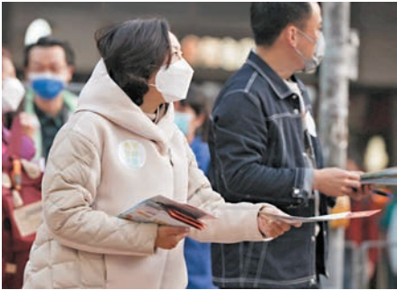
◆ 民青團隊到葵芳擺街站，大派《藍圖》小冊子同賀年揮春，向大家拜個早年。

香港文匯報訊 民政及青年事務局早前公布了《青年發展藍圖》，提出超過160項具體行動及措施，希望在各方面支援青年人發展。民政及青年事務局局長麥美娟連日落區進行街站宣傳，親身向年輕人解說《藍圖》的各項措施，同時聽取他們的意見。日前，麥美娟連同民青團隊，與立法會議員葉劉淑儀、容海恩及何敬康一起到上水擺街站派發三款適合不同青年人的《青年發展藍圖》小冊子。昨日，民青團隊到葵芳擺街站，聯同立法會議員吳秋北、郭偉強和陳穎欣，大派《藍圖》小冊子同賀年揮春，向市民街坊介紹《藍圖》的內容，兼向大家拜個早年。