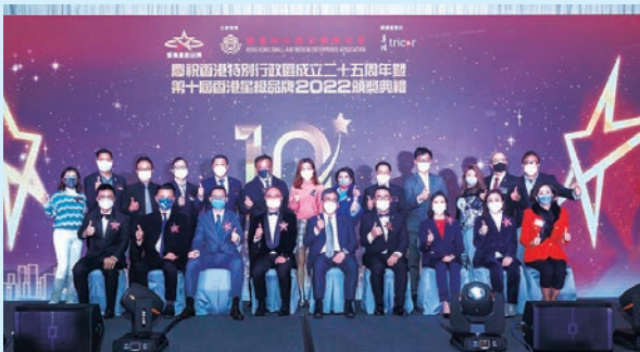
◆ 第十屆香港星級品牌2022頒獎典禮主禮嘉賓大合照。

由香港中小型企业聯合會主辦的慶祝香港特別行政區成立25周年暨第十屆香港星級品牌2022頒獎典禮，日前假尖沙咀唯港薈宴會廳舉行，商務及經濟發展局局長丘應樺出任主禮嘉賓，主禮團成員包括工業貿易署署長黃少珠，香港生產力促進局主席、立法會議員陳祖桓，立法會議員李鎮強、陳凱欣，香港中小企業聯合會會長郭志華、主席鄭仲邦及香港星級品牌2022籌委會主席霍俊文等。