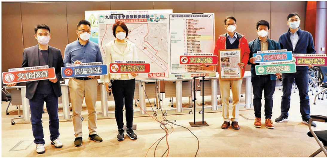
◆ 民建聯九龍城團隊即將展開《九龍城未來發展規劃建議》系列工作。

她指出，截至去年底為止，市建局和私營機構在九龍城區已開展逾14項涉及市區重建的發展項目，再加上逐步落實興建的「啟德發展計劃」，港鐵「觀塘綫延綫」、「屯馬綫」和「沙中綫」的先後開通，相信未來的九龍城將會有一個劃時代的發展，可謂機會與挑戰並重。政府正好承接上述的發展機遇，雙管齊下，補漏拾遺，做好妥善和完整的未來社區規劃，以配合未來人口發展趨勢。