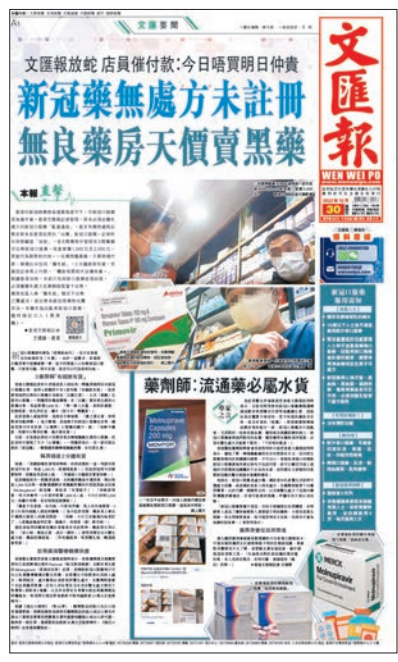
香港文匯報上週五報道，有藥房懷疑違規出售多款未在香港註冊的「山寨」新冠口服藥。資料圖片

已購買相關產品的市民應立即停止使用，如有疑問或用後感到不適，應徵詢醫護人員的意見。市民可於辦公時間內，將有關產品交予位於灣仔皇后大道東213號胡忠大廈1801室的衛生署藥物辦公室銷毀。