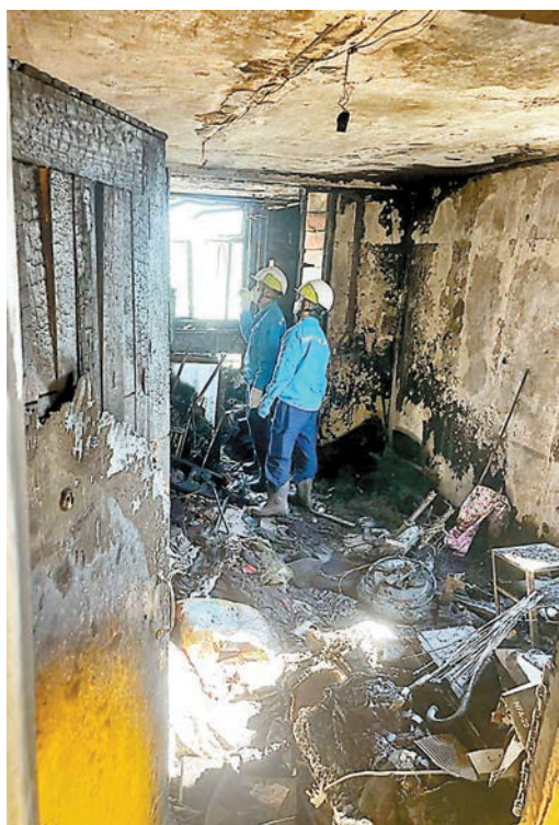
▶火警中，肇事單位嚴重焚毀，調查人員在內蒐證。