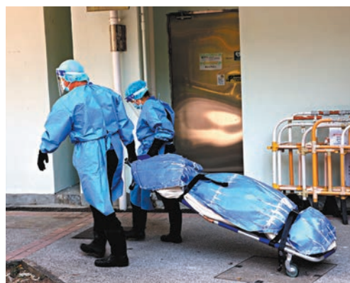
▲15歲女死者遺體由工昇送殮房。

俗稱「風火輪」的電動單輪平衡車又發生起火奪命意外。大圍美林邨一單位住戶的「風火輪」，昨清晨懷疑電池充電時起火，火勢迅速蔓延燒着全屋，女戶主負傷逃出單位呼救，但其15歲女兒及男住戶被困屋內，近百居民緊急逃生。消防員破門入屋灌救，在大門口發現少女焦屍，男女戶主及4名鄰居送院治理。