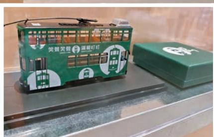
香港電車，品牌重塑以微笑為核心。