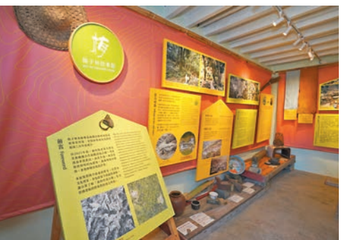
梅子林故事館設有常設展覽及特別主題展覽。