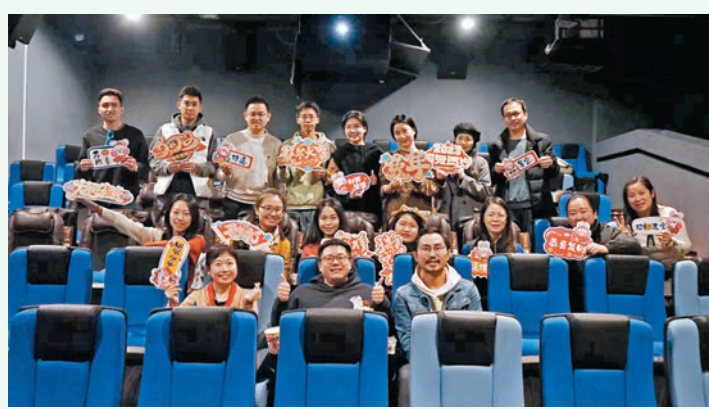
作者與同事和學生們在電影院歡送會合照。

原來我留下了這麼多回憶在這裏！同時，我也在某種意義上書寫着這些良師益友的回憶。我們在回憶中共同做着一件「前無古人」的