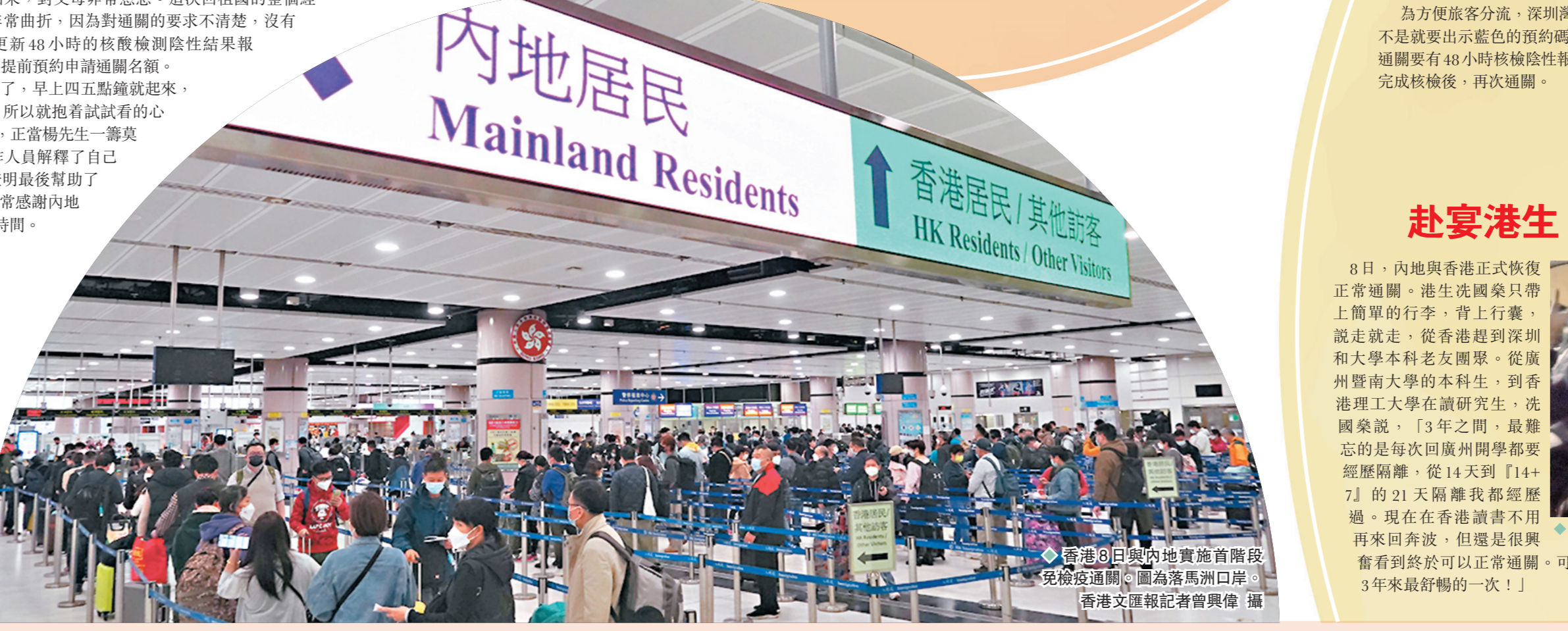
◆香港8日與內地實施首階段免檢疫通關。圖為落馬洲口岸。