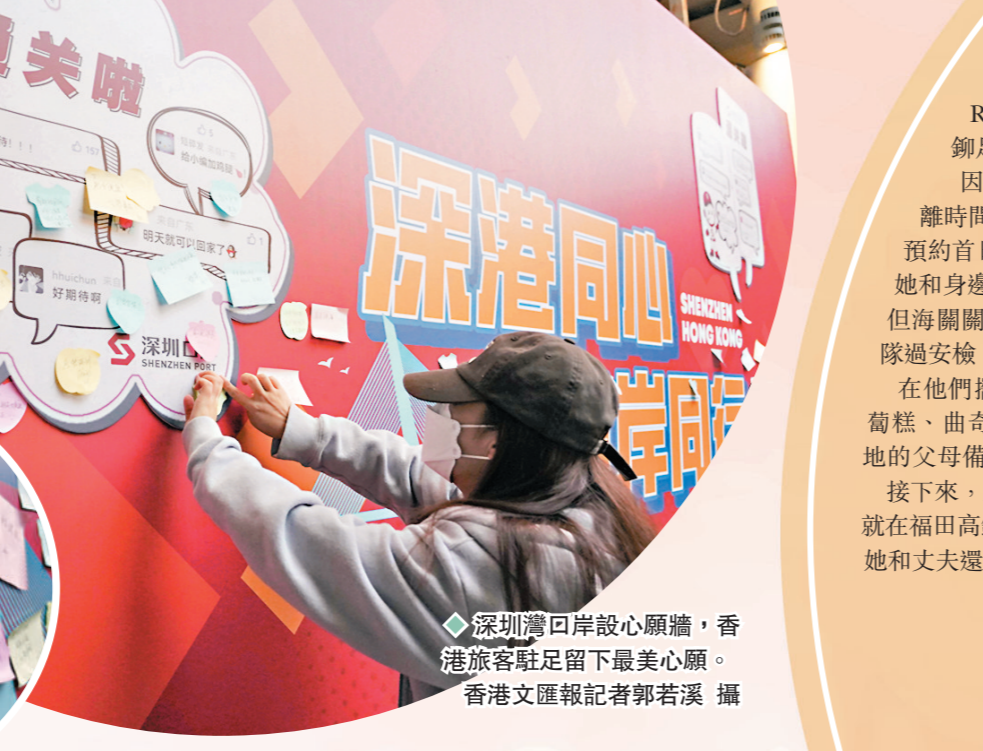
◆深圳灣口岸設心願牆，香港旅客駐足留下最真摯心願。

深圳灣口岸在入境口為入境旅客準備了「深港同心 口岸同行」心願牆，並為在心願牆上留言的旅客提供防疫小禮品。 深圳福田口岸廣場，樹上亦掛滿了串串紅燈籠，一塊巨大的紅色展板四角上掛滿了喜慶的氣球，展板中間寫着「歡迎香港同胞返深」，文錦渡口岸則掛上標語：「歡迎回家，祝您新年愉快！」 「我們要讓香港同胞感受到歸家的溫暖，辛苦一點不算什麼。」深圳市容協會的工作人員扮成四隻可愛的小白兔，手舉「灣區返理嚟」的宣傳牌，早上六點就開始在福田口岸廣場列隊歡迎回深的港人，因為打扮得可愛，「四隻小白兔」頻頻被港人拉着合影。在這個暖心的日子，大家都想釋放善意，傳遞溫暖。 8日，文錦渡口岸掛起紅色燈籠，布置了鮮花裝點氣氛，「歡迎回家，祝您新春愉快」的大橫幅，在口岸的出口十分顯眼。工作人員還為入境人員送上一枝鮮花。 隨著過關人員陸續增多，口岸設置的「深港同心」背景牆上留下的便利貼越來越多，「很激動，3年了，終於可以回家」、「回家真好」、「絲滑過關，非常感恩」、「疫情早日過去，大家都正常生活」……大家紛紛記錄下這特殊日子的激動心情，寫得最多的，就是「回家真好」。