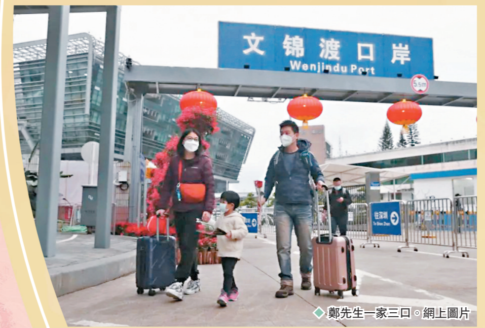
◆鄭先生一家三口。