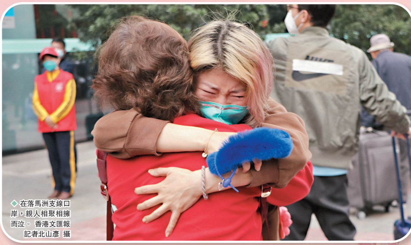
◆在落馬洲支線口岸，親人相聚相擁而立。

1月8日注定是一個難忘的日子。這一天，香港與內地恢復首階段免檢疫通關，疫情下冷清3年的關口重現人潮，大批港人「搶關」首日北上、南下，各口岸輪番上演令人淚目的場景：夫妻戀人深情相擁，執手相看淚眼；親朋好友重聚，歡欣之情溢於言表；更有許多遊子歸心似箭、步履匆匆，急切盼望出關後早日抵家見到父母。無論是開心興奮，還是激動落淚，這場期盼良久的「久別重逢」，終於還是在春節前給了所有人最溫暖妥貼的撫慰。 香港文匯報多路記者8日來到兩地各大口岸，見證了這感人至深的歷史畫面。歡笑、眼淚、喜悅、憧憬……帶着百感交集的情緒，有港人在深圳灣口岸為入境旅客準備的心願牆上寫道：「疫情早日過去，大家都正常生活」。 通關復常又邁進了一大步。 ◆香港文匯報記者 毛麗娟、郭若溪、李望賢、李昌鴻、敖敏輝、盧靜怡、唐文、吳健怡、張弦 深港連線報道