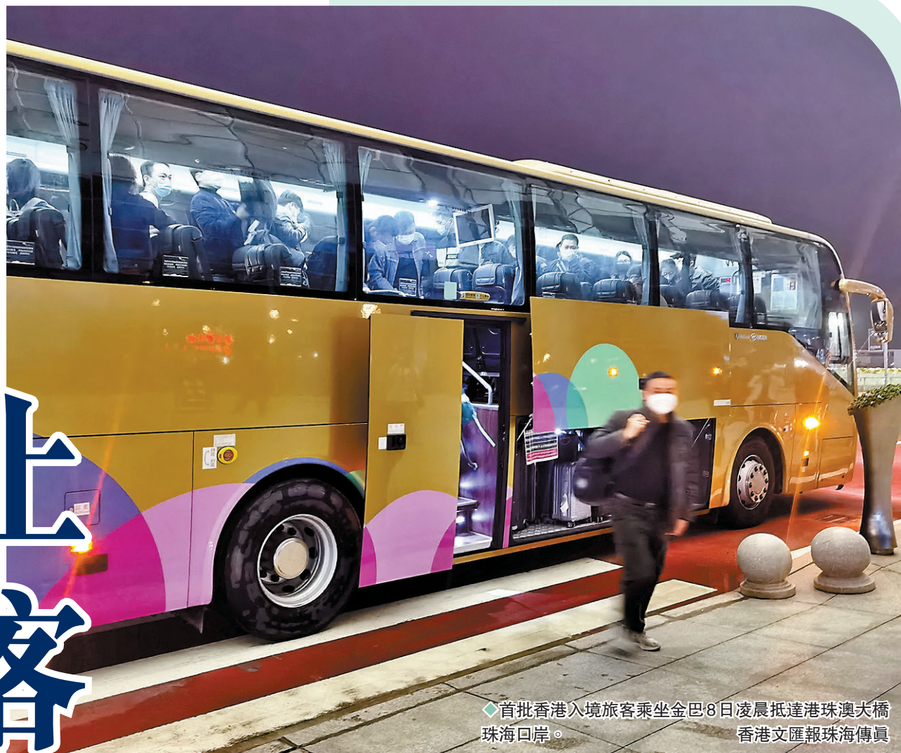
◆首批香港入境旅客乘坐金巴8日凌晨抵達港珠澳大橋珠海口岸。

香港文匯報訊（記者方俊明廣州報道）港珠澳大橋珠海口岸8日凌晨迎來首批香港入境旅客，他們乘坐港珠澳大橋穿梭巴士（金巴）北上，在珠海口岸查驗耗時不到1分鐘便順利通關。有港人表示，搶先來體驗「免隔離」通關便利，「今年一家人終於可以回鄉過過年」。據金巴官網的信息顯示，8日凌晨0時、2時等多個時段車票提前銷售一空，而從上午8時到晚上20時基本每半小時均有發車班次。目前港珠方向金巴恢復24小時營運，增開至168個班次。港珠澳大橋邊檢站透露，從零時開始，幾乎每輛入境的金巴都滿載旅客，預計8日珠港方向出入境旅客將近1萬人次。