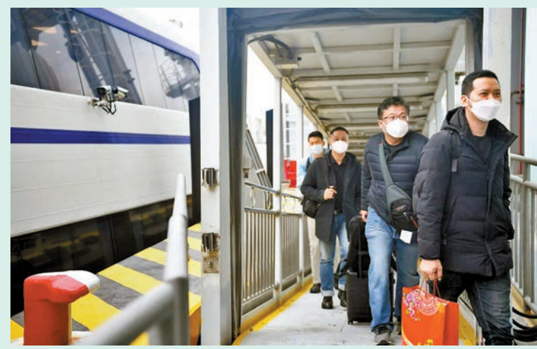
◆蛇口郵輪母港8日迎來首批乘船由港來深的旅客。

該航線是複製香港機場碼頭與內地各碼頭運營的「海天聯運」模式，力圖打造內地首個「海空聯運、無縫連接」的機場碼頭，持續暢通香港市區往返深圳市區的水上客運通道，有效地加快推動粵港澳大灣區綜合立體交通網絡實現互聯互通。同時，由珠江客運運營（代理）的港澳碼頭往返深圳蛇口碼頭、香港機場碼頭往返深圳蛇口碼頭的2條深港水上航線也在1月8日順利復航，其中港澳碼頭往蛇口航班的上座率達85%。