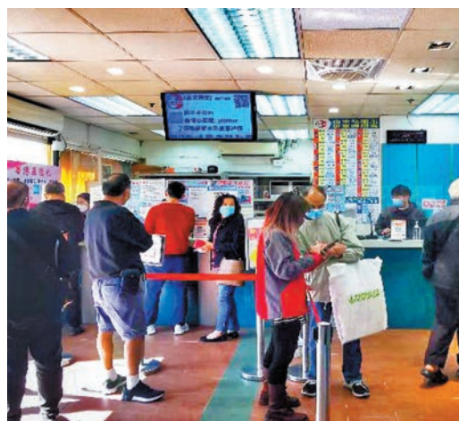
◆旅客在「粵港直通巴」香港票務中心諮詢及預訂車票。

香港文匯報訊（記者方俊明廣州報道）香港與內地8日起恢復通關，「粵港直通巴」全面升級，目前已調配跨境車輛55台，完成復崗培訓考核跨境駕駛員近百名迎接「通關」；其中港深間的班線於8日率先恢復，將逐步恢復香港至廣州、江門等珠三角以及其他地區城市的長途班線；預計1至2月每天恢復長途班線往返24個班次。