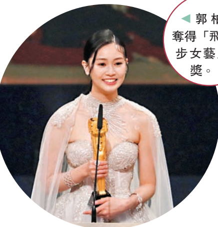
郭柏妍奪得「飛躍進步女藝員」獎。