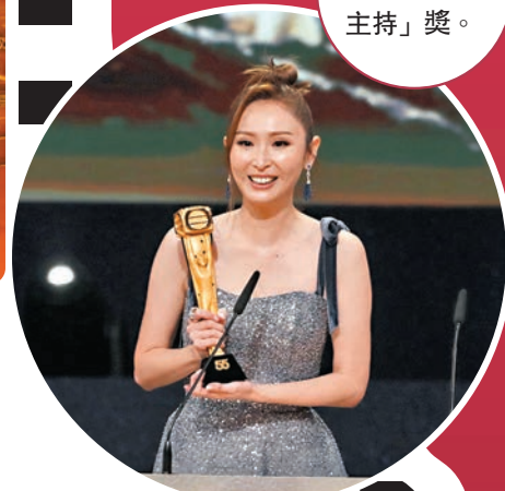
陳貝兒再獲「最佳女主持」獎。