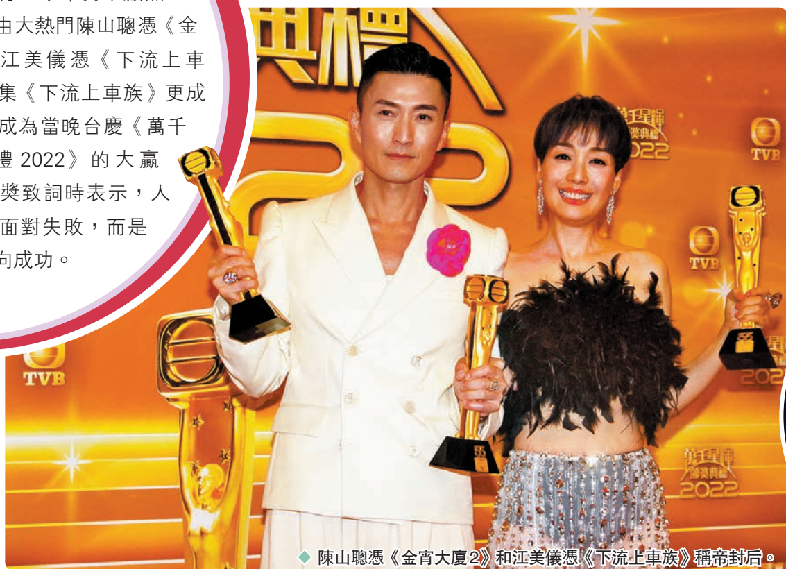
陳山聰憑《金宵大廈2》和江美儀憑《下流上車族》稱帝封后。

香港文匯報訊（記者 梁靜儀、達里）無線《萬千星輝頒獎典禮2022》昨晚假將軍澳電視廣播城舉行，今年賽果激烈，視帝視后分別由大熱門陳山聰憑《金宵大廈2》和江美儀憑《下流上車族》榮膺；劇集《下流上車族》更成為最佳劇集，成為當晚台慶《萬千星輝頒獎典禮2022》的大贏家。陳山聰得獎致詞時表示，人生最艱難不是面對失敗，而是如何由失敗走向成功。