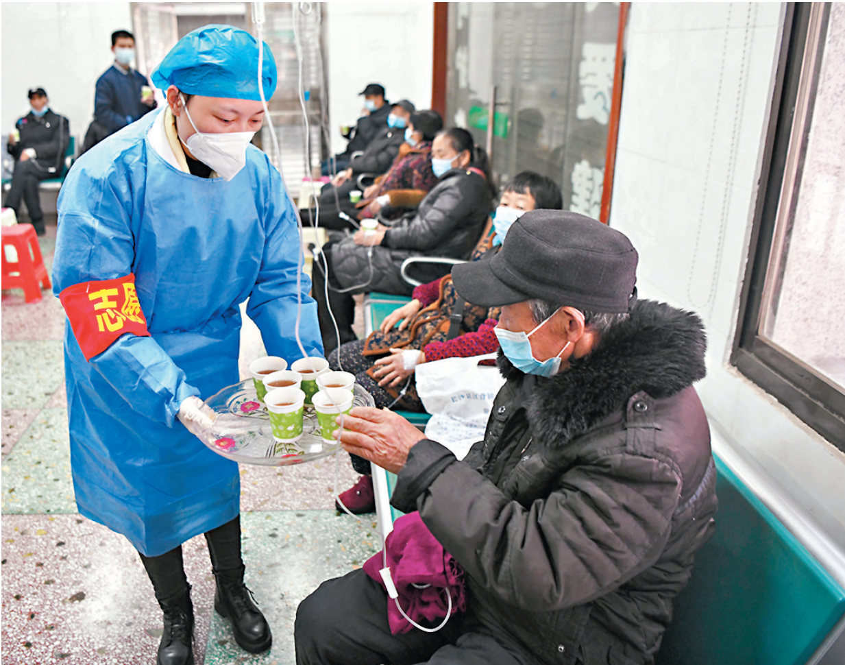
◆1月5日，湖南長沙縣江背鎮中心衛生院的醫護人員向當地居民免費提供新冠防治中藥，並為居家老人送藥下鄉。 中新社

第十版方案中提出可以採取緊急防控措施，雷正龍就此表示，新冠疫情爆發、流行的時候，也可以適時、依法、選擇性地採取一些緊急防控措施，包括暫緩非必要的大型活動、暫停大型娛樂場所的營業活動；博物館、藝術館等室內公共場所採取適量的限流措施；嚴格管理養老機構、社會福利機構等脆弱人群集中的場所；實行錯時错峰上下班、彈性工作制，或者採取居家辦公等措施；還有教育機構採取臨時性線上教學等。一旦疫情得到緩解，當地政府應該及時宣布緊急防控措施的解除。