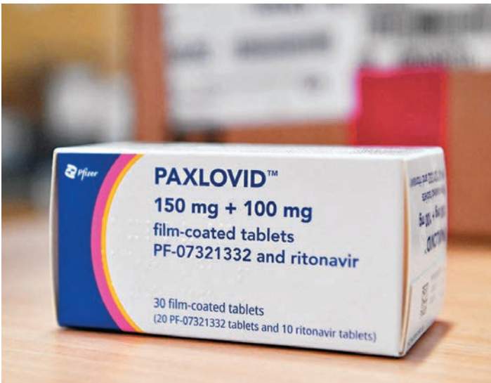
◆輝瑞新冠藥品奈瑪特韋片/利托那韋片組合包裝（Paxlovid）。

此外，阿茲夫定片、清肺排毒顆粒經過本次談判納入國家醫保藥品目錄後，國家醫保藥品目錄內治療發熱、咳嗽等新冠症狀的藥品已達600餘種。同時，為滿足各地新冠感染患者治療需要，近期各地醫保部門結合當地醫保基金運行情況，又將一批新冠對症治療藥物臨時納入本地醫保支付範圍。總體來看，醫保報銷的新冠病毒感染治療用藥品種豐富。 國家醫保局還表示，近期已印發《新冠治療藥品價格形成指引（試行）》，對防治新冠病毒感染所需的新上市抗病毒治療藥品，採取全周期多層次的措施引導企業公開透明合理定價。