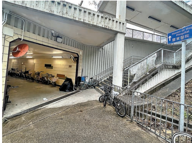
◆獨行匪在將軍澳靈實醫院附近一條行人隧道搶劫女護士。

香港文匯報訊(記者 蕭景源)一名匪徒前晚深夜在將軍澳靈實醫院附近行人隧道內，從後箍頸搶劫一名女護士。護士奮力反抗及呼救驚動途人趕至援手，匪徒慌忙攜同護士約4,000元財物逃走，慌亂中將自己銀包跌在現場，內有其身份證等資料。警員根據線索，於案發後1小時登門拘捕疑犯。