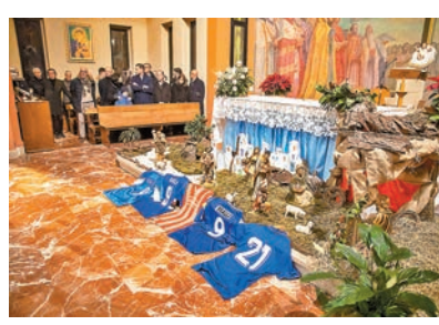
◆追悼會教堂地上鋪上了維埃里的球衣。