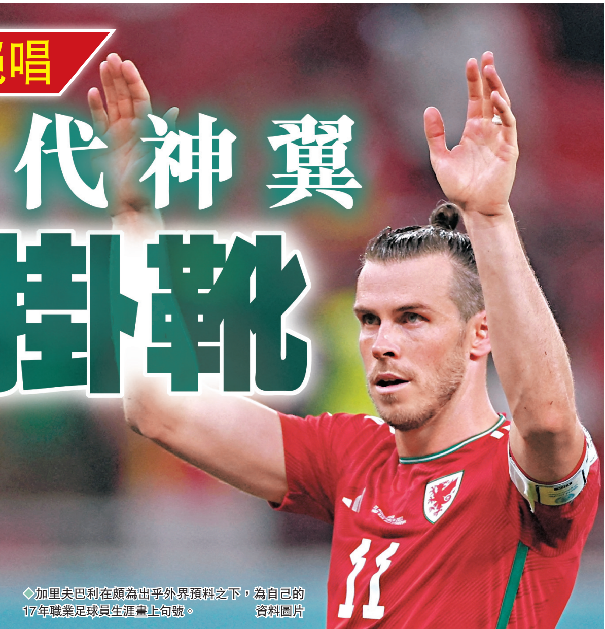
◆加里夫巴利在頗為出乎外界預料之下，為自己的17年職業足球員生涯畫上句號。資料圖片

綜合新華社報道，威爾斯球星加里夫巴利於當地時間9日通過個人社交媒體宣布，從今開始退出球會及威爾斯足球隊，為自己17年職業足球員生涯畫上句號。外號「大聖爺」的巴利今年33歲，仍然是在當今球壇還可多踢幾年的足球年齡，不過，他在感言中表示，自己人生中的一個章節已到了結束之時，足球給了他生命中最棒的時刻，並已經開始期待翻開人生新篇章。