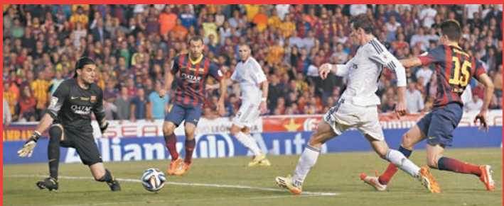
◆2014年西班牙盃決賽第84分鐘，巴利(右二)左路面對巴塞隆納的馬斯巴查(15號)防守，直接將球傳向巴塞後場，再突然加速繞道場外，搶在回追的巴查前拿球，長驅直入禁區冷靜射入，幫助皇馬奠勝2:1。