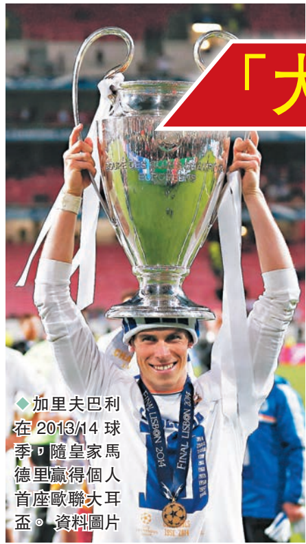
◆加里夫巴利在2013/14球季，隨皇家馬德里贏得個人首座歐聯大耳盃。資料圖片