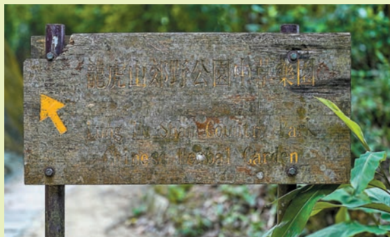
◆「龍虎山郊野公園」的路標因風雨沖刷字體已經褪色。