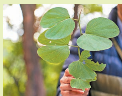
◆春天是萬物生長的季節，也是最適合栽種草藥的時機。

的品種。龍虎山在經歷寒冬後，也渴望從這個春天破土而出，像山野間的草藥那樣堅韌而富有內涵，將全新的面貌展示給每一位遊客。