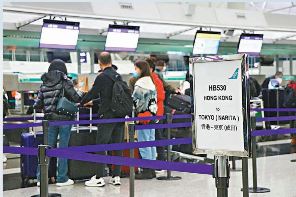
◆香港機場人流恢復不少，部分旅客目的地為東京，正在櫃檯辦理手續。