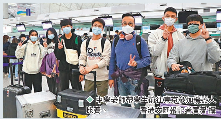
◆中學老師帶學生前往東京參加機器人比賽。

曼谷和台北之後，大灣區航空的第三個航點——日本東京昨日首航。飛機共約180個座位，機票上月開售，火速獲150多位乘客認購參與首航。乘客Michelle是疫情以來第一次旅行，指選擇該航線是因為時間合適，「早上9時20分起飛，唔使起身得太早，又唔會太遲到東京，該公司航班通常也很少延誤。」一間中學的老師則帶領學生前往東京參加機器人比賽，各人都表現得十分雀躍。