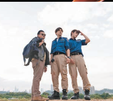
◆張敬軒、魏浚笙捲入百年一遇的鑽石爭奪戰。