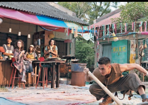
◆《超神經械劫案下》於1月21日賀歲黃金檔盛大公映。