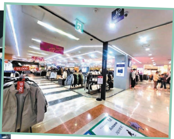
▲「W購物中心」人流稀少。