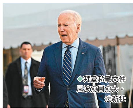
◆拜登私藏文件風波愈鬧愈大。