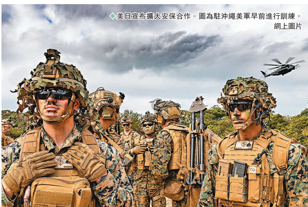
◆美日宣布擴大安保合作。圖為駐沖繩美軍早前進行訓練。網上圖片