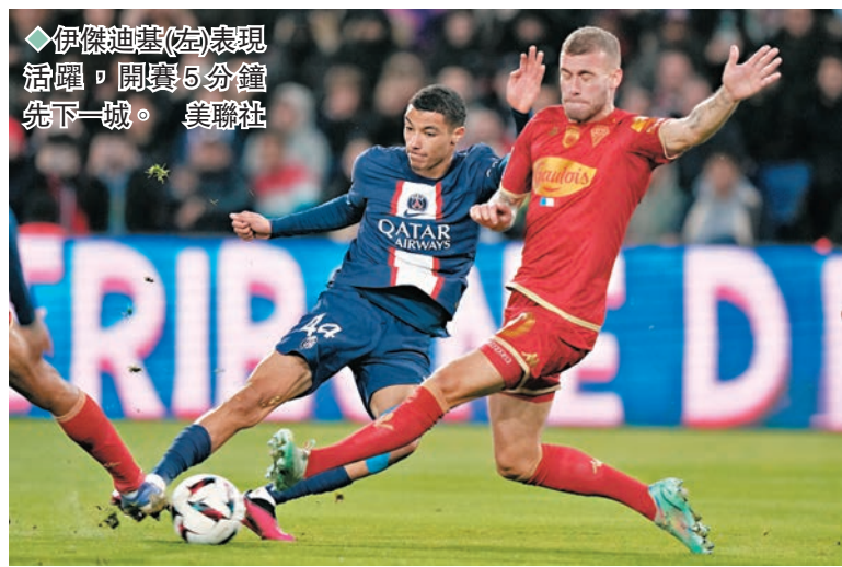
伊傑迪基(右)表現活躍，開賽 5 分鐘先下一城。

媒體估計，這與巴黎聖日耳門始終是法甲球隊有關，而美斯代表的阿根廷在世盃決賽正正是擊敗了法國隊，這難免令 PSG 的支持者們心情複雜。相信是球會考慮到球迷的心情，因此並沒有為美斯安排特別的慶祝儀式；不過在日前他回到球隊訓練時，PSG 球員都有列隊歡迎，向他道賀。