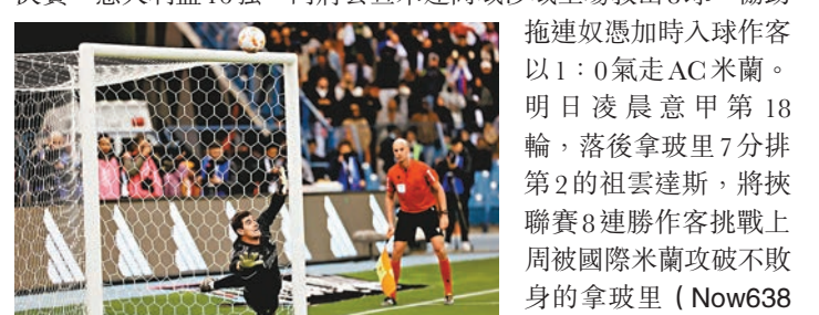
拖連奴憑加時入球作客以 1:0 氣走 AC 米蘭。明日凌晨意甲第 18 輪，落後拿玻里 7 分排名第 2 的祖雲達斯，將挾聯賽 8 連勝作客挑戰上周被國際米蘭攻破不敗身的拿玻里 (Now638 台周六 3:45a.m. 直播)。

香港文匯報訊 (記者 梁志達) 昨日凌晨的歐洲盃賽兩位門將都成為英雄。在沙特阿拉伯舉行的西班牙超級盃 4 強對陣華倫西亞，皇家馬德里在實施馬入球後下半場被逼和 1:1，最終互射 12 碼馬「門神」高圖爾斯擋出荷西加耶主射的最後一輪，贏 4:3 晉級決賽。意大利盃 16 強，門將雲查米連高域沙域全場救出 8 球，協助