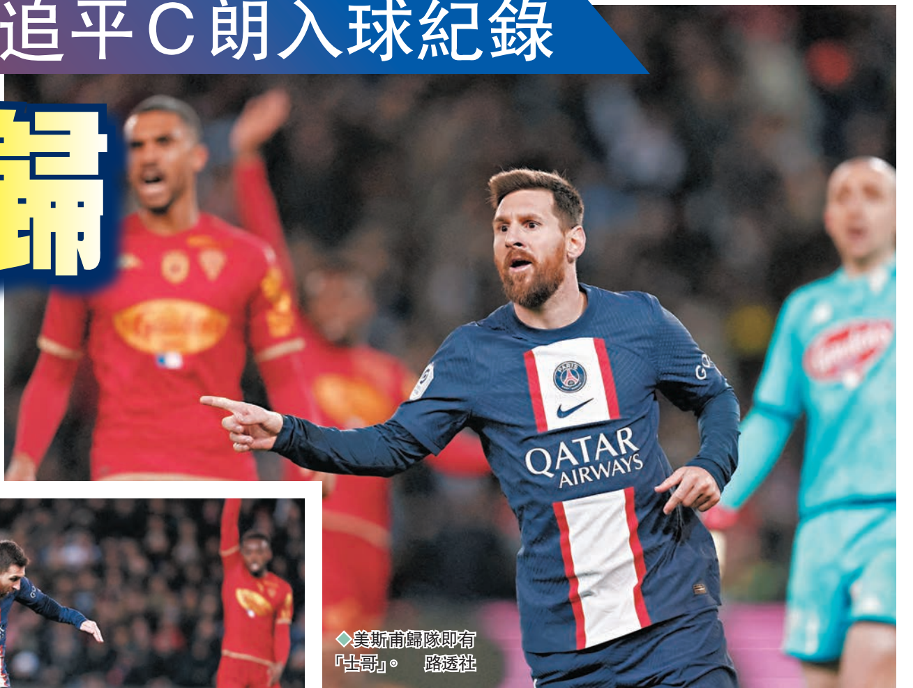
美斯甫歸隊即有「大哥」路透社