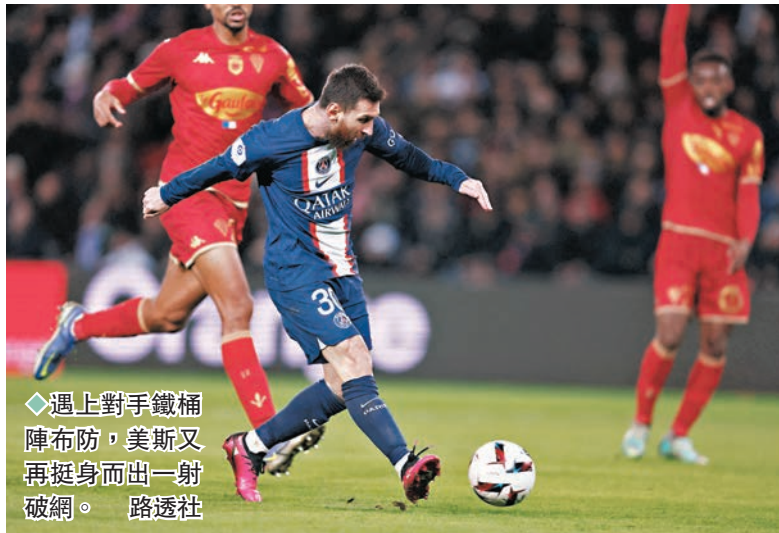
遇上對手鐵桶陣布防，美斯又再挺身而出一射破網。