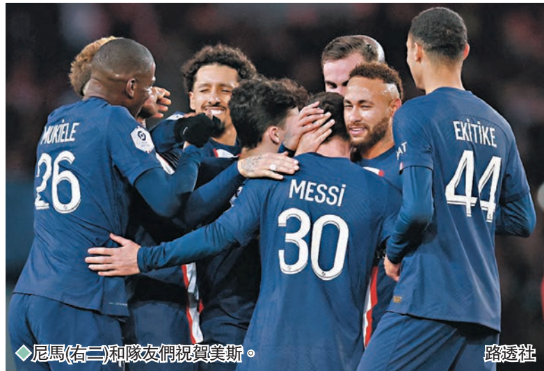
尼馬(右二)和隊友們祝賀美斯。