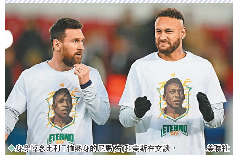
身穿悼念比利T恤熱身的尼馬(右)和美斯在交談。

五戰世界盃終於在卡塔爾得償冠軍夙願的美斯，結束休假後以王者之姿榮歸球會賽場，披上巴黎聖日耳門 (PSG) 球衣重上戰陣。剛復出的他並不需要太多時間重新適應節奏，在這場法甲聯賽即顯「球王」本色領軍 2:0 輕取昂熱，儼如是在宣告，即使 35 歲的自己已錦標盡攬，卻不會就此滿足，前面還有一些歷史正等待着可改寫，例如是役就追平了老對手C朗拿度的五大聯賽入球紀錄。