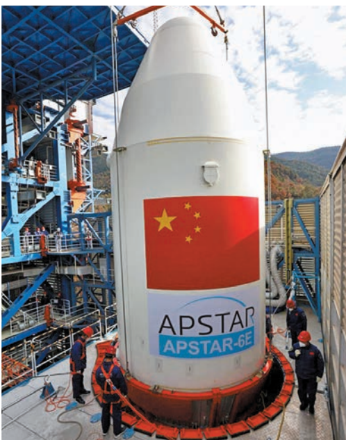
◆準備發射期間，亞太6E衛星在整流罩中。

據介紹，亞太6E衛星不僅是東方紅系列新一代經濟型全電推商業通信衛星，更是中國首顆全自主實現軌道轉移的衛星。亞太6E的成功發射無論是對於實現衛星平台高承載、低成本，提升中國衛星平台國際競爭力，還是對於實現衛星全