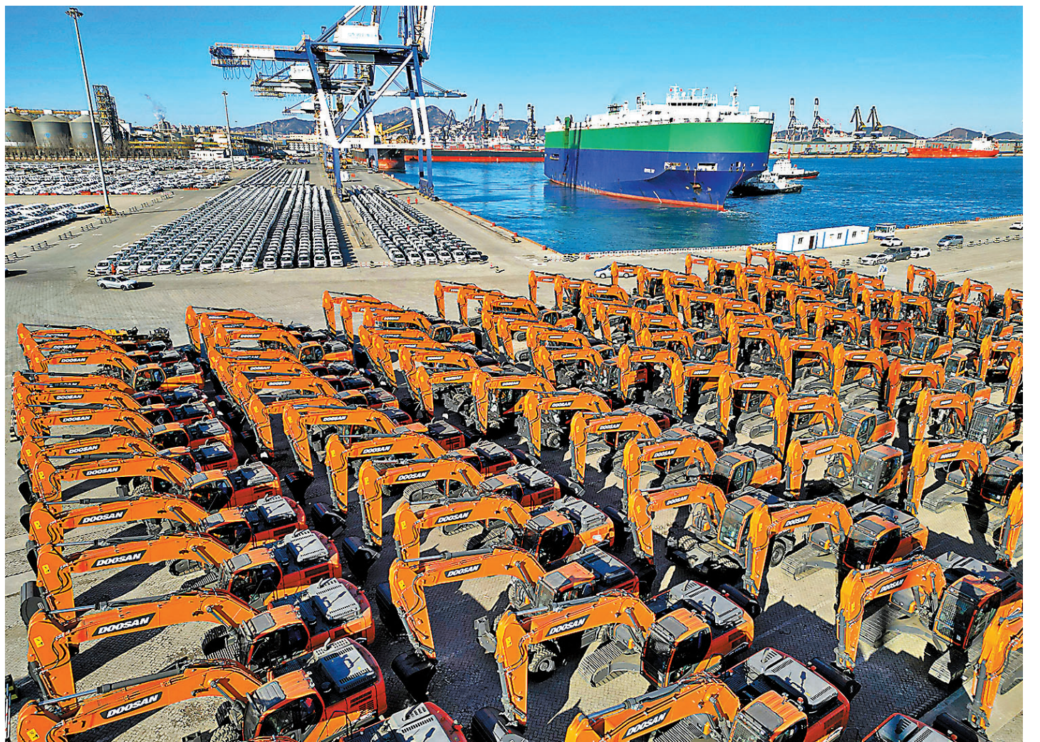
◆中國去年外貿規模首破40萬億元關口。圖為1月9日，一艘滿載出口商品車的滾裝船駛離山東煙台港。

展望2023年外貿形勢，呂大良表示，當前中國經濟恢復的基礎尚不牢固，外部環境動盪不安，世界經濟下行壓力不斷加大，外貿發展面臨的困難挑戰仍然較多。正視這些困難挑戰的同時，也要看到中國經濟韌性強、潛力大、活力足，長期向好的基本面依然不變，經濟有望總體回升，推動外貿穩規模、優結構具有堅實支撐。