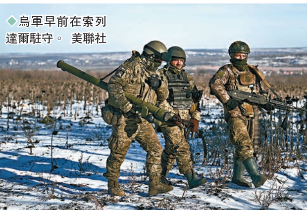
◆烏軍早前在索列達爾駐守。