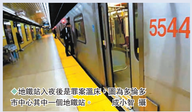
◆地鐵站入夜後是罪案溫床，圖為多倫多市中心其中一個地鐵站。