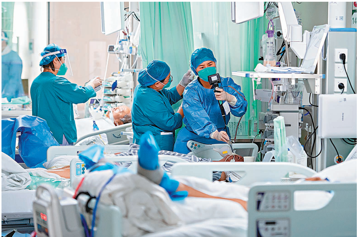
◆目前內地重症患者數量仍處於高位。圖為1月9日，山西省太原市，山西白求恩醫院重症醫學科醫護人員救治重症患者。

焦雅輝表示，內地本輪新冠感染重症患者有以下特點，一是以老年人為主，年齡最大的105歲，平均年齡75.5歲，60歲及以上的患者佔比89.6%；二是普遍合併有