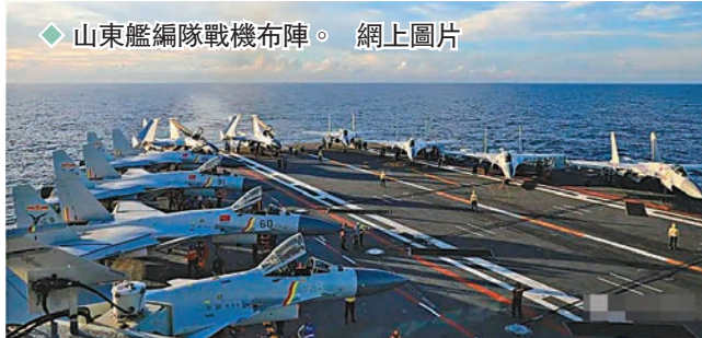
◆山東艦編隊戰機布陣。

香港文匯報訊 據人民海軍微信公號消息，隆冬時節，南海某海域，白浪如練，暗流湧動。由多艘不同型號艦艇、數十架各型戰機組成的山東艦編隊在此擺兵布陣，一場實戰化對抗演練一觸即發。