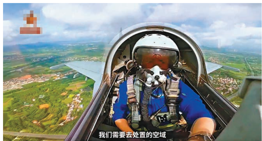
◆殲-16飛行員日常有戰備起飛應對空中威脅。 視頻截圖

軍強大的實戰戰力。據殲-16飛行員介紹，殲-20擁有隱形性和機動性的優勢，在空戰格鬥等領域更具優勢，殲-16則具備強大的載荷和航程，在戰鬥中具有無可替代的意義。在實戰中，殲-20將扮演「端門手」的角色，通過隱形性優勢躲開敵方地空雷達，優先「敲掉」對方的預警機等空中態勢感知平台，並引導後方的殲-16機隊向標定的敵方地面目標展開精確的空襲，從而將殲-20的隱形和殲-16的強大火力「強強結合」，發揮出更好的戰術效果。