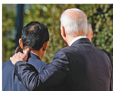
◆拜登(右)與岸田搭膊頭狀甚親切。

拜登與岸田文雄會晤時，雙方表示會深化兩國同盟關係，促進在經濟、防務、氣候變化等領域的合作。岸田其後揚言稱，中國是日和美國的「核心挑戰」，宣稱日本與歐美需加強合作，團