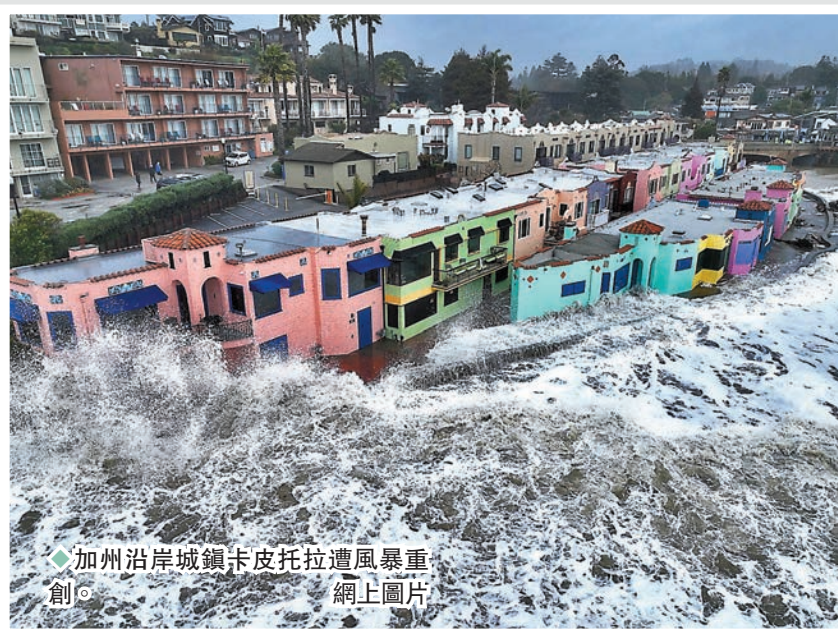
◆加州沿岸城鎮卡皮托拉遭風暴重創。

加州今次連串暴雨已持續逾半月，造成多地洪災氾濫。統計顯示加州今次暴雨災害累計降雨量，相當於24萬億加侖的雨水從天而降，幾乎與舉世聞名的尼亞加拉大瀑布一年的總流量相若。氣象專家預計加州本週末還將迎來兩輪風暴，降雨或到下週中才能逐漸停止。