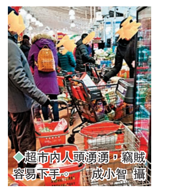
◆超市內人頭湧湧，竊賊容易下手。