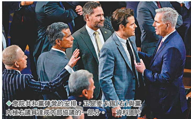
◆眾院共和黨陣營的安排，正是麥卡錫(右)與黨內極右議員達成內部協議的一部分。