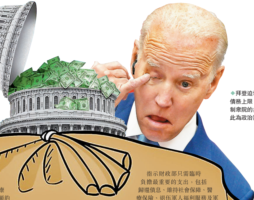
◆拜登迫切希望提高債務上限，但卻被控制眾院的共和黨人以此為政治籌碼。

債務上限由美國國會為聯邦政府設定，當中涵蓋社會保障、醫療保險和軍人薪酬等，現有限額約為31.4萬億美元（約245.5萬億港元）。耶倫致函眾議院議長麥卡錫等國會領袖強調，財政部為避免政府債務違約，計劃本月實施「非常措施」，暫停退休基金和聯邦僱員福利等部分投資，維持政府運作。 最盡撐到6月 急需提高債務上限 耶倫稱，若以「非常措施」配合現有資金，政府預計可以撐到今年6月，但類似措施只能短期救急，讓政府在有限時間內支付債務，關鍵還需國會盡快通過議案，提高美國債務上限。否則一旦出現債務違約，美國將無法發行新債，政府也面臨停擺風險，「這將對美國經濟、民眾生計和全球金融穩定造成無法彌補的傷害」。 要求政府減稅 削減多項開支 然而在美國國會，民主、共和兩黨正就債務上限問題爭執不下。總統拜登政府迫切希望提高上限，控制眾院的共和黨人則以此為籌碼，要求通過提升債務上限法案的同時，還要加入多項減稅政策。共和黨極右翼勢力更希望利用債務上限問題施壓，要求美國政府削減多項開支。《華盛頓郵報》報道稱，共和黨已計劃否決財政部的應急計劃，改為