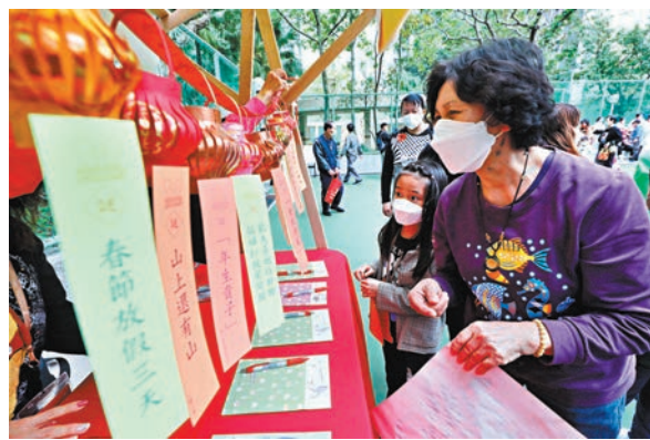
◆趣味謎語吸引不少市民試玩。

高敬德致辭時表示，2023年是不一樣的新年，中央決策復常通關，全港熱烈歡呼，一通百通，三年疫情陰霾將一掃而空，相信兩地人民沒有了阻隔，大家更能胸心相連。春節是中華民族最隆重的傳統節日，蘊含了辭