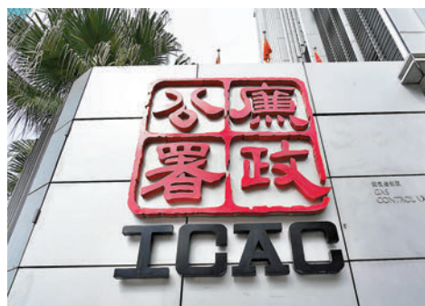
◆廉政公署昨落案控告一名私人屋苑承辦商前清潔監督欺詐、偽造等6項罪名。資料圖片

香港文匯報訊(記者 蕭景源)廉政公署昨日起訴一名現年63歲的私人屋苑承辦商前清潔監督，控告欺詐、偽造等6項罪名，指其涉嫌虛報3名清潔工人的出動紀錄，以欺騙薪金共逾86萬元。被告已獲准保釋，本週三(18日)在屯門裁判法院答辯。