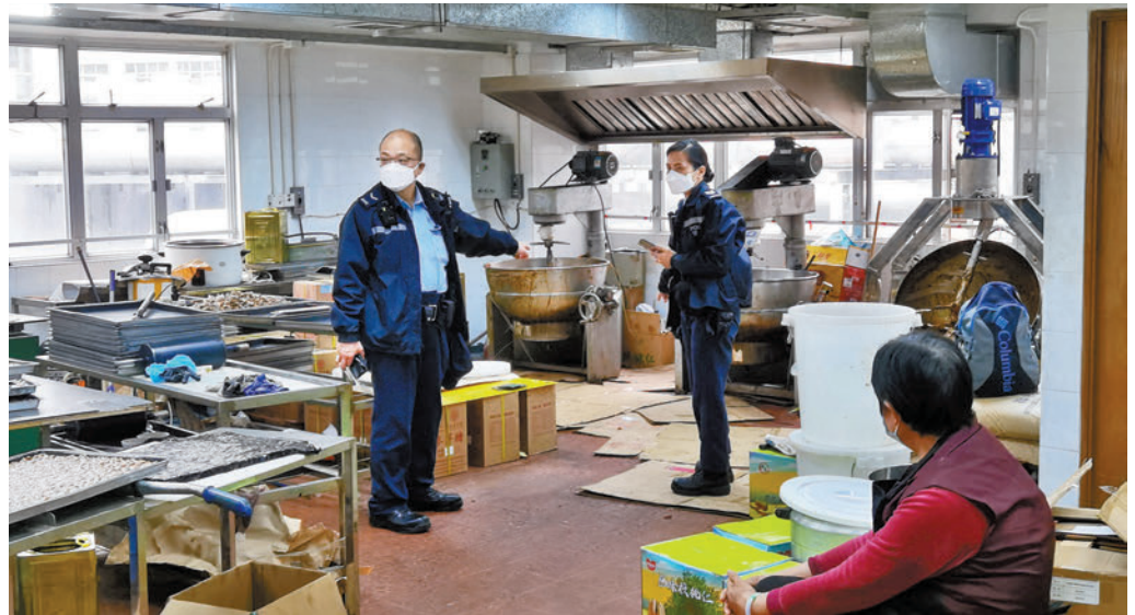
◆意外中，女事主疑失足跌入正在運作的大型攪拌機被攪桿夾困，由消防員救出送院不治。

有關工業安全團體指，估計本港部分小型工場也未有特別關注大型攪拌機配置安全罩問題，若大型攪