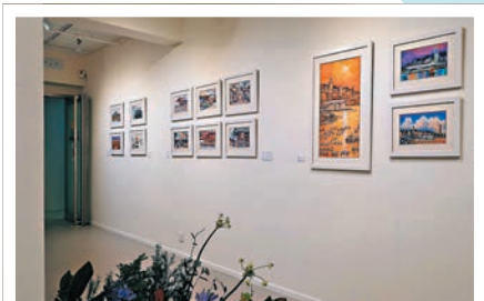
◆畫家筆下城市的新舊更替中，也流露出他這些年創作的心態轉變。黃依江 攝