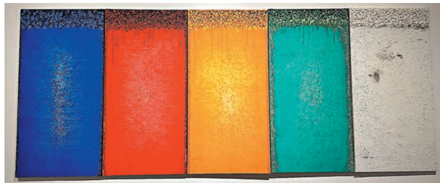
◆作品《五色之二》。

個展覽的空間設計與藝術家邵泳的作品相融合，完成了這個轉變的旅程：天地與我並生，萬物與我唯一。