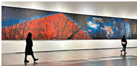
◆巨幅作品《史詩》吸引觀眾參觀。

展覽現場，隨著《兩岸終南》《十二生肖》《新山海經》《山與海》等一幅幅色彩對比度大、空間感深邃的作品呈現在眼前，一種強烈的壓迫感甚至敬畏感迎面撲來。經過一個細長的走廊，展廳牆壁逐漸由深灰色變成白色，巨幅作品《史詩》的出現，讓人眼前一亮，為之震撼。《起世》《再藍田一千年藍田對話王維》《涅槃之一》《黃與藍》《五色之二》等作品，則讓觀者有一種豁然開朗之感。策展人楊墨白表示，整