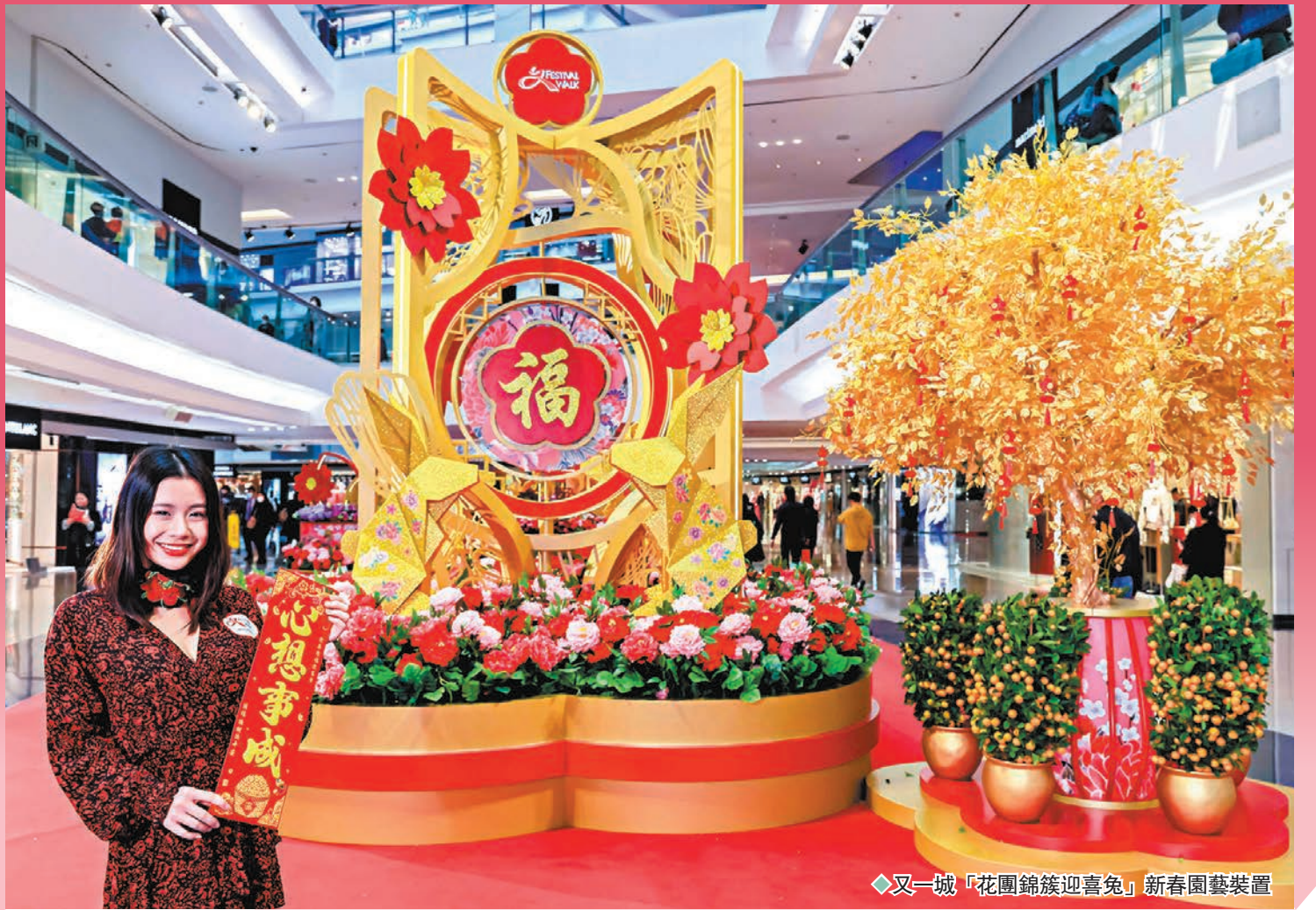
又一城「花團錦簇迎喜兔」新春園藝裝置

兔年將至，祝願新的一年家家戶戶滿載歡樂！為迎接癸卯兔年，今個星期當你走進商場裏，應該不難發現各式各樣的新春布置，當中不乏花團錦簇的，布置中必有桃花的影子；同時不少商場還與藝術及插畫師合作，將其角色融入新春布置中，打造喜氣洋洋的裝置，散發富貴吉祥的氣氛，讓大家於新春兔來運轉，年年有餘，幸福滿載。