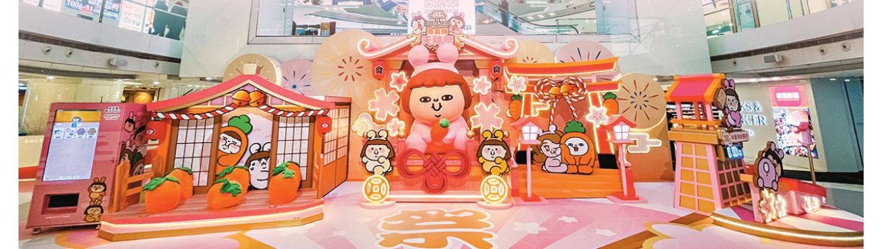
皇室堡 x PLASTIC THING 「為食妹」天神祭