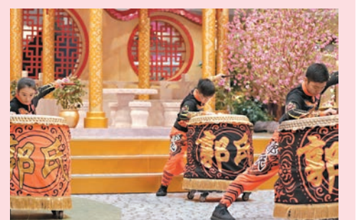
郭氏功夫金龍醒獅團隊獻技

又一城與大家喜迎癸卯兔年，由即日起至2月5日特別呈獻「花團錦簇迎喜兔」，以寓意好兆頭的元素如「花開富貴」、「鴻兔大展」、「滿福臨門」及「十全十美」匠心打造喜氣洋洋的裝置，並邀請到屢獲殊榮的郭氏功夫金龍醒獅團隊親臨獻技，呈獻旗鼓變臉新春匯演。同時，為喜迎新歲，商場還打造以萬紫千紅為主調的新春園藝裝置，巧妙地糅合桃花、牡丹花等時今年花，展現風采萬千的明媚春色，散發富貴吉祥的氣氛。在姹紫嫣紅的花叢中，喜見一隻隻栩栩如生的金兔，展現躍動飛舞氣派，寓意兔來運轉，鴻兔大展，步步高陞。金兔的上方綴以