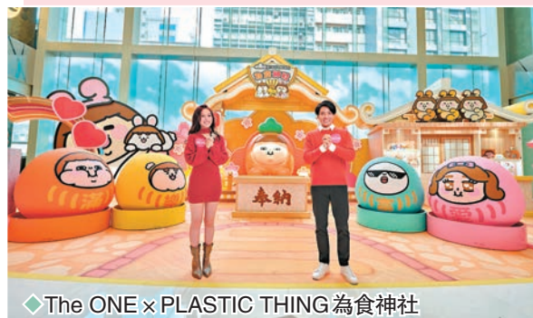
The ONE x PLASTIC THING 為食神社

到神社參拜祈福是年頭指定動作，今個新春 The ONE 及皇室堡聯同「Whateversmiles × PLASTIC THING」於即日起至2月5日舉辦「The ONE·皇室堡 × PLASTIC THING 為食天神祭」，PLASTIC THING 系列角色——「為食妹」、「Puffy」、「女神」及「光頭仔」一直人氣高企，其Instagram擁有超過40萬粉絲追蹤，各角色皆搞笑幽默，作品更時常叫人看到忍俊不禁！當中人氣爆燈的就要數到以生命投向了美食的「為食妹」，「為食妹」為了於兔年再下一城，以2.5米高的黃金蘿蔔造型坐鎮「The ONE × PLASTIC THING 為食神社」，加上以應景吸睛的簇新粉紅兔仔造型亮相「皇室堡 × PLASTIC THING 『為食妹』天神祭」，聯場更設有8大祈福熱點，「皇室堡 × PLASTIC THING 天神販賣機 by Whateversmiles」及「The ONE × PLASTIC THING 『兔滿長肥』期間限定店 by Whateversmiles」，15款限定兔年產品發售。而且，兩間商場還特意推出6款兔年別注版周邊，各款產品獲 PLASTIC THING 核心人物加持，帶著任何一款做隨身物，來年必定幸福滿載。