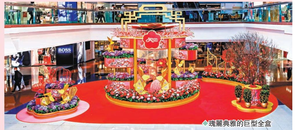
瑰麗典雅的巨型全盒

金光璀璨的福字裝置，祝願大家滿福臨門。而另一展區則是一座瑰麗典雅的巨型全盒，寓意十全十美，年年有餘。