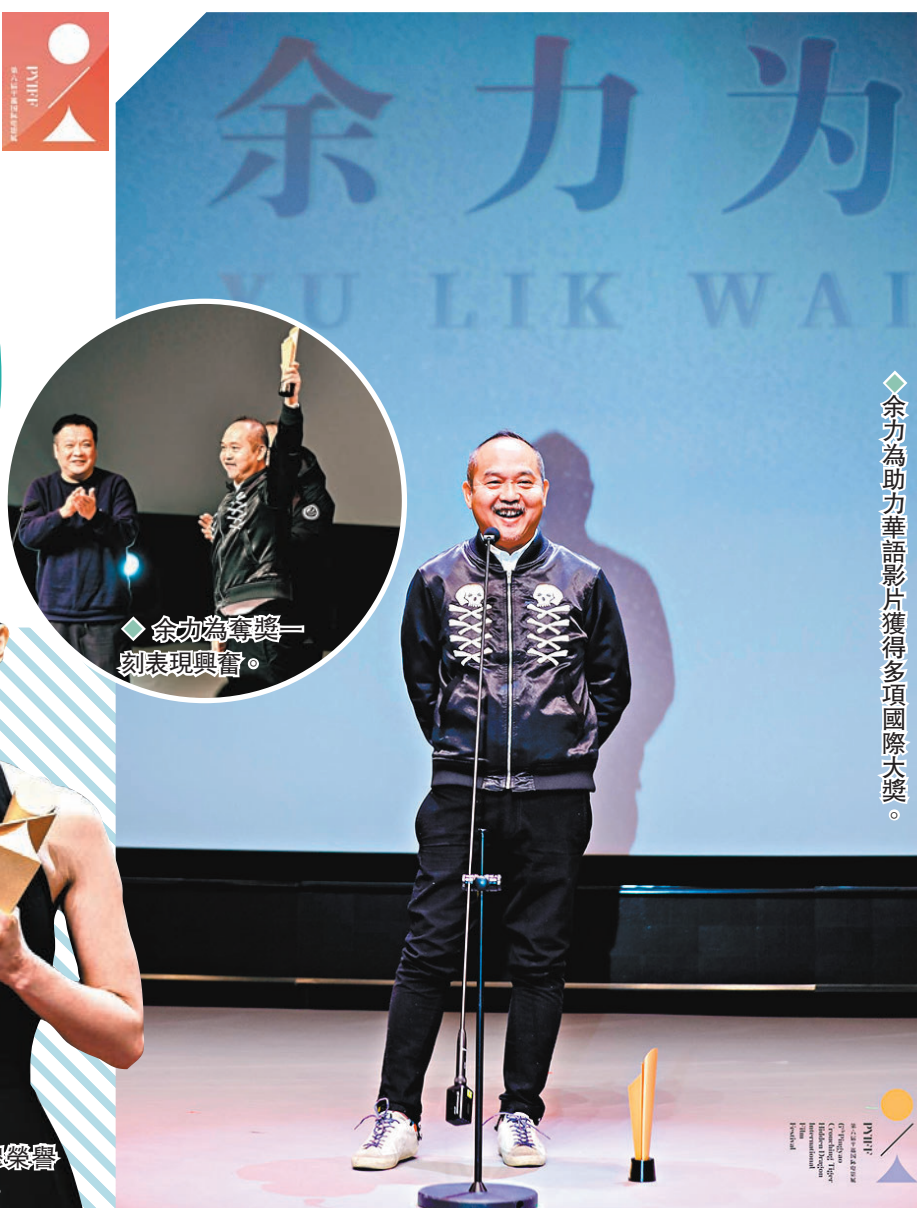
◆余力為獲獎一刻表現興奮。