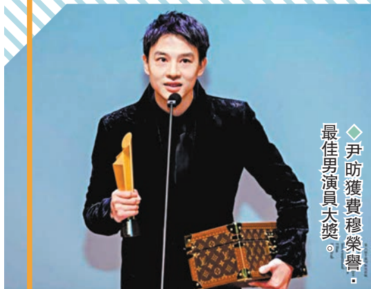
◆尹昉獲費穆榮譽最佳男演員大獎。

第六屆平遙國際電影展（簡稱：平遙影展）「平遙之夜」特別活動前晚在平遙電影宮「小城之春」廳盛大舉行，本屆影展官方展映單元各項榮譽得主最終揭曉。香港攝影師、導演余力為榮獲「臥虎藏龍東西方交流貢獻榮譽」，韓國影片《下一個素熙》獲得表彰國際新人新作的「羅西里尼榮譽」最佳影片，《夜幕將至》獲得鼓勵華語電影的「費穆榮譽·最佳影片」。《溫柔殼》導演王沐獲得「費穆榮譽·最佳導演」，主演尹昉、王子文包攬最佳男、女演員兩項榮譽。