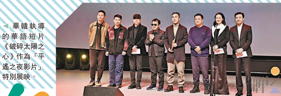
◆畢贛執導的華語短片《破碎太陽之心》作為「平遙之夜影片」特別展映。