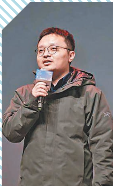
◆導演王沐獲費穆榮譽最佳導演。