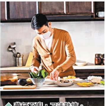
◆華仔下廚，刀法熟練。

MV拍攝的氛圍有一種家的溫暖感覺，看着地球儀的華仔畫面作開首，享受悠閒的每一刻，當中一幕華仔與吳京鏡頭前分別下廚露兩手，現場工作人員知悉華仔吃素，細心地準備了素菜，以便拍攝華仔烹煮的畫面，熟練的刀法、一下子將粟米和蘿蔔切片，再放進熱水中，這份濃情「煮」意難得一見，讓現場工作人員讚嘆不已。