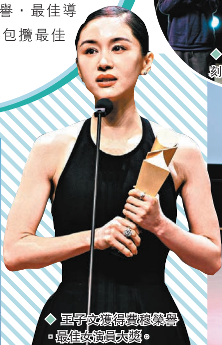
◆王子文獲費穆榮譽最佳女演員大獎。