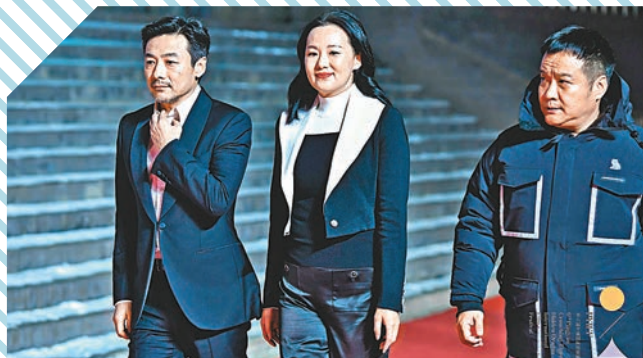
◆寧浩、詠梅、祖峰作為參展嘉賓亮相。