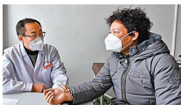
◆1月15日，河北省唐山市豐南區中醫院醫師在為患者號脈。

中國疾控中心傳防處研究員常昭瑞表示，近期國外檢出Deltacron毒株，該毒株是奧密克戎（Omicron）變異株BA.4、BA.5和德爾塔（Delta）變異株AY.45的重组體，國際分類命名為XAY.2。該毒株於2022年8月31日首次在南非發現，目前在全球9個國家和地區監測到。2022年12月以來，以丹麥為主的極少數國家呈升高趨勢，目前還沒有關於該病毒傳播力、致病力和免疫逃逸能力等方面的足夠數據。目前，內地尚沒有監測到XAY.2的變異株。中國將繼續跟蹤國際動態，進一步加強輸入病例和本土病例新冠病毒變異株的監測，及時開展分析研判。