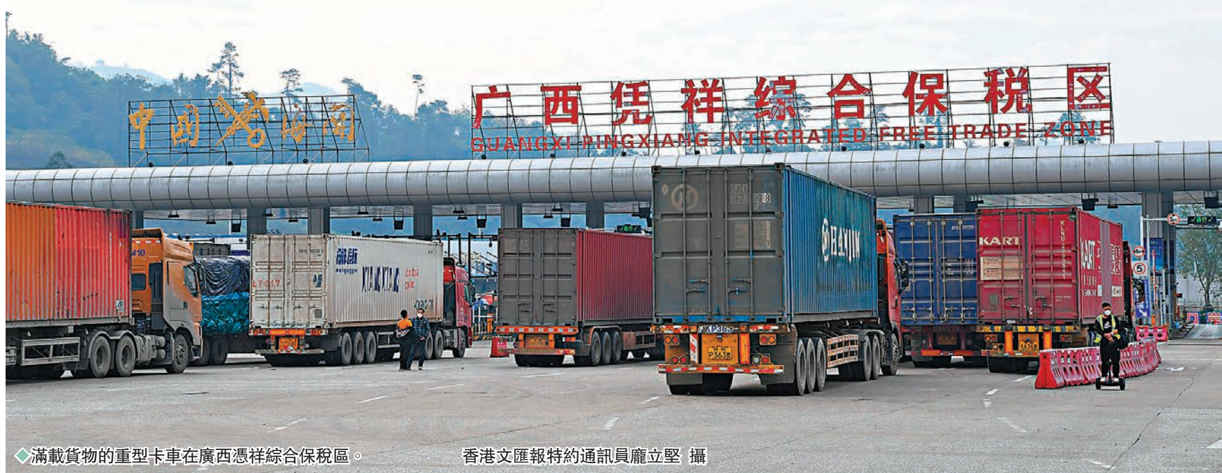
◆滿載貨物的重型卡車在廣西憑祥綜合保稅區。

近年來，鐵路跨境貨運成為許多內地民眾購買進口商品的重要來源之一。國鐵憑祥口岸物流中心是目前內地唯一可辦理進境水果直通運輸業務的鐵路口岸，年前大量來自東盟國家的龍眼、榴蓮、菠蘿蜜等水果搭乘跨境列車運往國內市場。據國鐵南寧局集團公司有關負責人介紹，當前從越南進口的貨物不再需要進行核酸抽樣檢測，貨物到達國鐵憑祥口岸後直接按正常手續辦理。年貨品通關速率提高，進口貨運量也比以往有所增加。