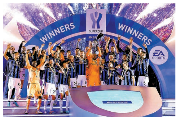
◆國米勇奪意超盃冠軍。

後36歲的他笑言感覺自己才「快將22歲」，豪言寶刀未老。施蒙尼恩沙基則表示，希望「這(冠軍)能為已隊於聯賽衝刺增添動力。」意甲賽罷18輪，國米現時排名第4，落後領頭的拿波里達10分，身前往有AC米及祖雲達斯。