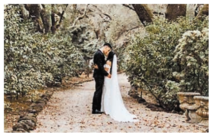
◆林書豪公開結婚照。

領域的部分就一直很低調。他透露，一夕成名後沒人教他該如何去應對，而他則想竭盡所能地讓他的私生活保持神聖且忠於自我，他認為，要守護生活中比較私人一面時，就沒有辦法跟大家分享他生命中重大的改變。