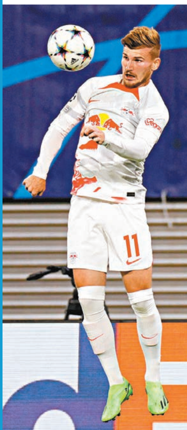
◆養傷兩個月的迪姆華拿已經康復，可望復出替RB萊比錫錫鋒陷陣。 資料圖片