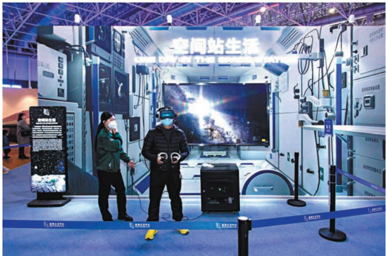
◆ 遊客佩戴VR眼鏡體驗太空站生活。