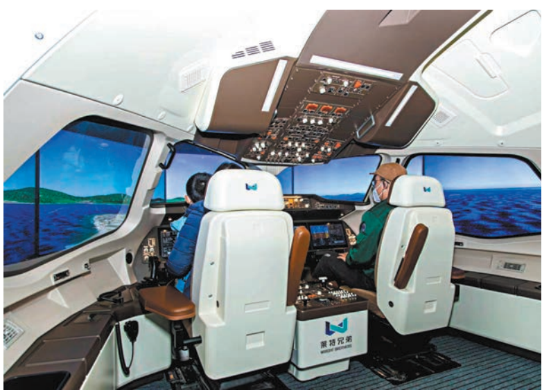
◆ C919大飛機模擬駕駛艙。