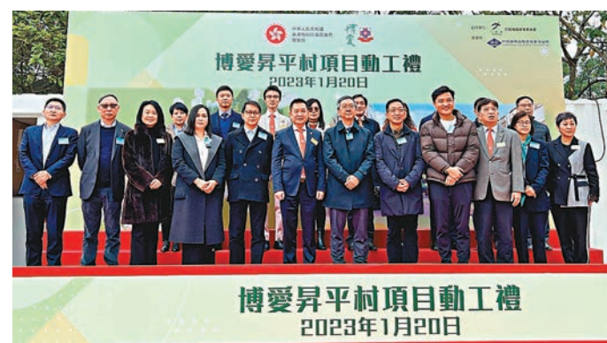
◆博愛醫院過渡性房屋項目「博愛昇平村」昨日舉行動工禮。

康、家庭因素或其他升學安排等申請退學，部分學生會因應職業發展路向申請轉校選科，轉投薪酬待遇較佳和具專業資格之科系，亦有人改往海外升學，或重考文憑試希望爭取佳績入讀心儀學科。