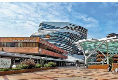
◆香港理工大學各級課程共有656人終止學業，為八大最多。資料圖片

康、家庭因素或其他升學安排等申請退學，部分學生會因應職業發展路向申請轉校選科，轉投薪酬待遇較佳和具專業資格之科系，亦有人改往海外升學，或重考文憑試希望爭取佳績入讀心儀學科。