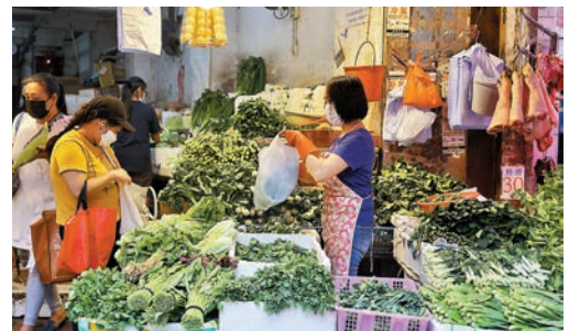
◆新鮮蔬菜價格上升，上月基本通脹率為2%。資料圖片

香港文匯報訊（記者 費小燁）政府統計處昨日公布，上月整體消費物價按年升2%，較去年11月的1.8%升幅為高。在剔除所有政府一次性紓困措施的影響後，上月基本通脹率為2%，亦