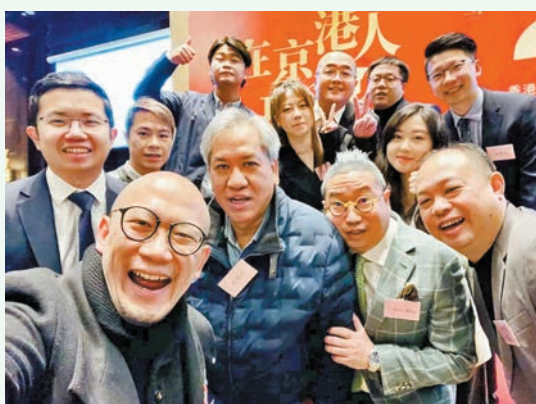
◆在京港人新春會「港專協」同仁合照。

其實這些日子還有一個重要的工作，那就是休息。見了見想見的朋友，又在北京周邊玩了一圈，我的狀態也終於能在長時間的工作後取得放鬆。香港中聯辦換帥，原來的駐港國安公署署長鄭雁雄先生成為新的主任。在新的講話中，鄭先生更是提出「香港工作是『國