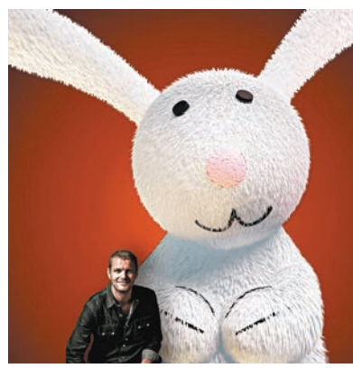
◆藝術家 Florentijn Hofman 創作了《月兔》。

香港文匯報訊 曾創作經典維港「黃色巨鴨」的藝術家 Florentijn Hofman 受恒基地產邀請，帶着作品《月兔》登陸虛擬世界兼首次「現身香港」，首先打響頭炮的是萌爆的「福兔迎春」電子賀卡，在賀卡影片開首，毛茸茸的巨型月兔在家鄉荷蘭綠意盎然的清幽草原上愜意地打盹，天空突然出現了恒基地產象徵希望和活力的「永恒之輪」，好奇的月兔隨即跳進「永恒之輪」一探究竟。月兔瞬間穿梭到燈火通明的上海街頭，牠龐大的身影在著名地標建築間自由穿梭遊覽！月兔轉眼間就跳到繁華熱鬧的香港，在電車頂觀賞醒獅賀歲，更跑到海旁欣賞璀璨奪目的維港夜景，與大家