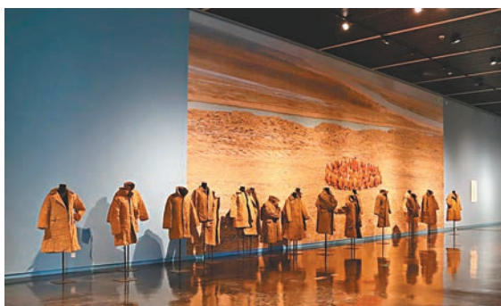
▲▼「大地」呈現王剛的行為藝術、裝置藝術和大地藝術作品。