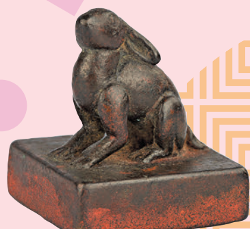
「子良」兔鈕銅印 明 香港中文大學文物館藏