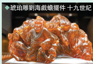
琥珀雕劉海戲蟾墜 十九世紀

在歐洲，宗教的對立直接影響了琥珀貿易，德國統治者佔領了波羅的海地區，並且控制了琥珀主要產地的採收和生產，由於德國的波羅的海地區信奉新教，其工場專注於世俗藝術作品，並使用最優質的琥珀製作。因此在今次展覽中，觀眾可以欣賞到來自東西方琳瑯滿目的琥珀製品：遠代精緻的琥珀珠寶、掛件、佛器及小雕像，以及明朝期間皇室所有的琥珀花瓶、吊墜、項鍊、耳環、髮簪；歐洲天主教區以琥珀製作的玫瑰念珠、花冠念珠等宗教物品。