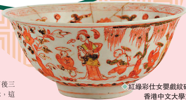
紅綠彩仕女嬰戲紋碗 明嘉靖 香港中文大學文物館藏