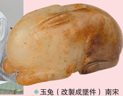
玉兔(改製成墜件) 南宋 香港中文大學文物館藏