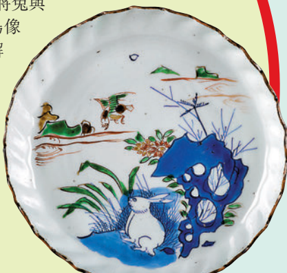
青花五彩鷹兔紋盤 明晚期 香港中文大學文物館藏