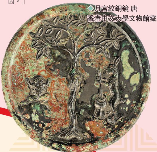
月宮紋銅鏡 唐 香港中文大學文物館藏