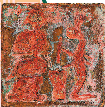
西王母玉兔搗藥龜鈕銅印 漢 香港中文大學文物館藏