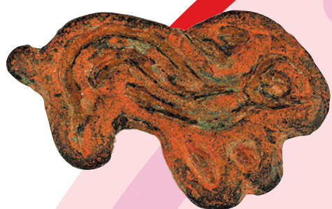
兔紋肖形銅印 元 香港中文大學文物館藏