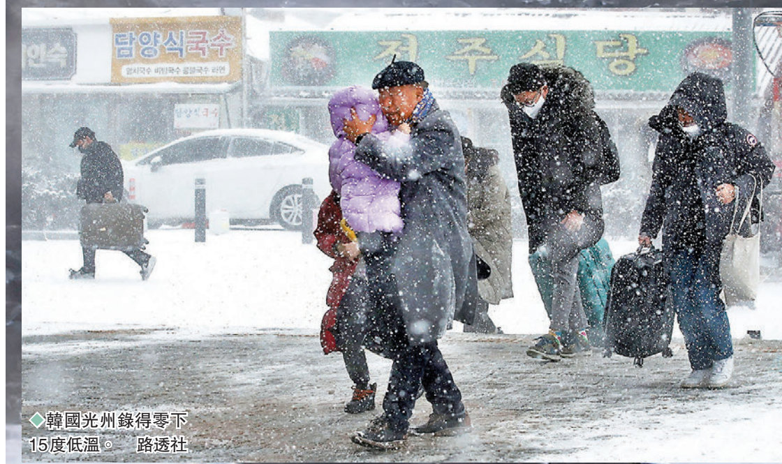
◆韓國光州錄得零下15度低溫。