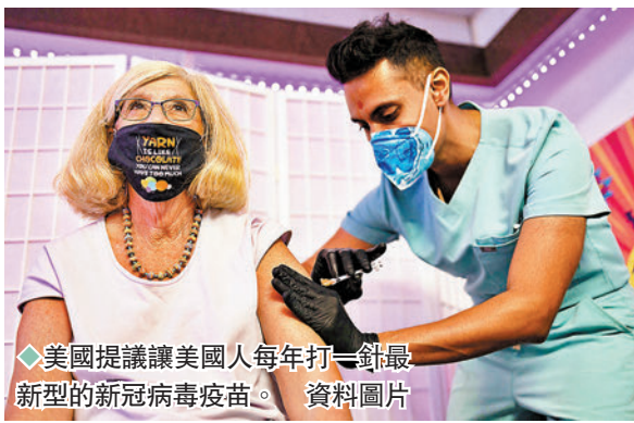
◆美國提議讓美國人每年打一針最新型的新冠病毒疫苗。資料圖片