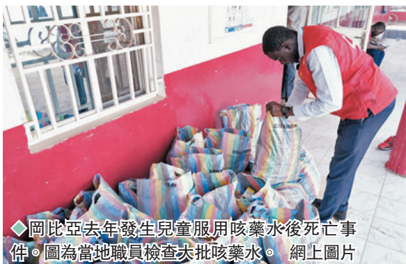
◆岡比亞去年發生兒童服用咳藥水後死亡事件。圖為當地職員檢查大批咳藥水。網上圖片