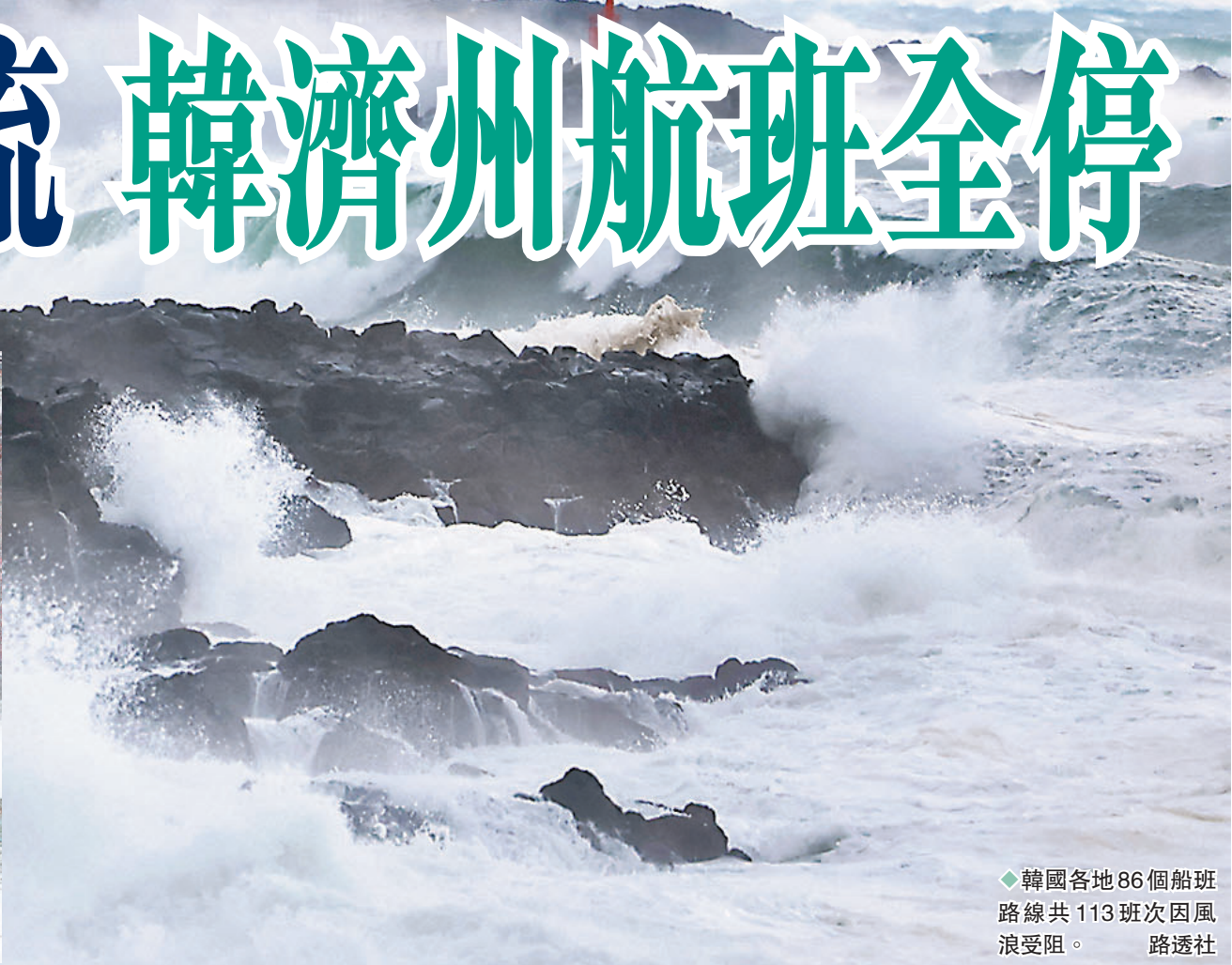
◆韓國各地86個船班路線共113班次因風浪受阻。

日本氣象廳預測，日本各地直至明天仍會受寒冷天氣和大雪影響，關東甲信、北陸、本州山陰山陽地方、九州北部和南部或出現大雪，東北、東海、近畿和四國地區還可能出現警報級大雪。預計東京市中心今日最低氣溫為攝氏零下2度，北海道札幌為零下12度，名古屋及京都市為零下3度。