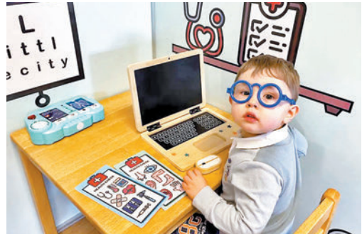
◆霍布斯懂得用中文、法文、德文、西班牙文等7種語言由1數至100。網上圖片