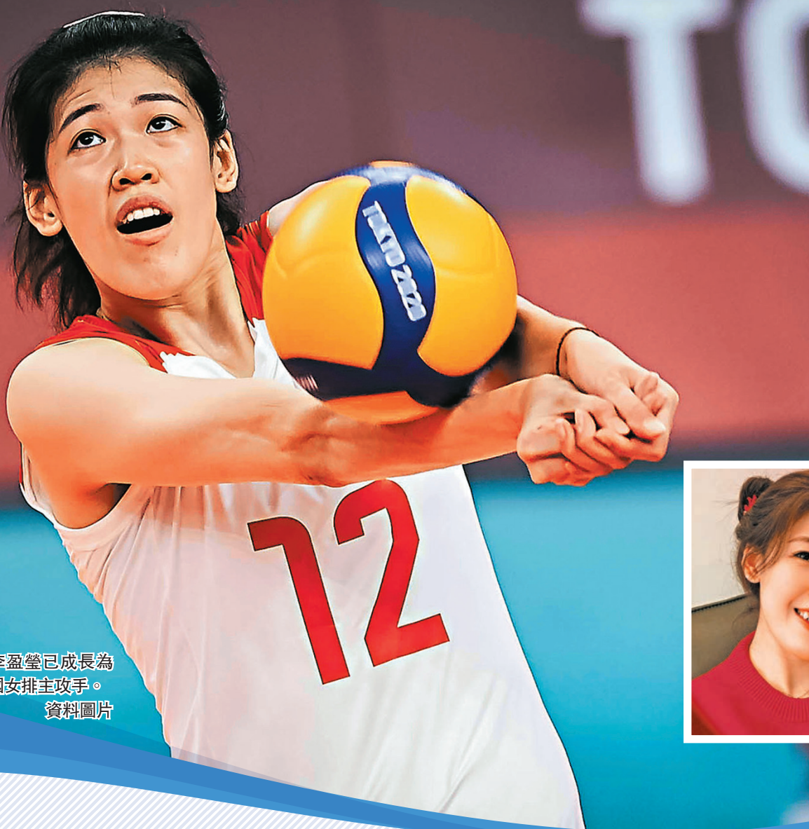
◆李盈瑩已成長為中國女排主攻手。資料圖片