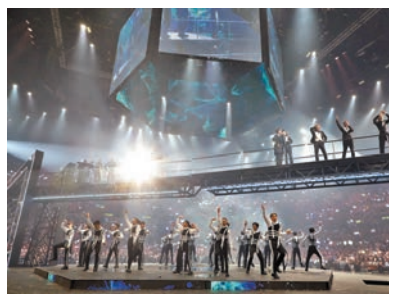
◆勞工處就 MIRROR 演唱會事故檢控3間公司共15罪。圖為 MIRROR 演唱會。

他指出，政府有關部門於去年11月發表的演唱會意外調查報告中提出了一系列改善措施，包括從紅館場地租用人守則方面，加強專業人員監督舞台工程安全、引入第三方獨立檢查人員檢查工程與裝置等，以確保舞台裝置符合安全要求。當時，政府表示會在未來數個月，康文署會與業界商討及落實新措施的執行細節，並修訂租用條款，他期望政府適時交代確保政府場地舞台安全的各項措施進度。