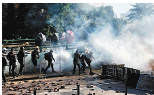
◆女文員於2019年兩個月內連涉兩宗暴動案，法官直言再犯是加刑因素。圖為理大暴動期間，暴徒嘗試突圍失敗。

被告另涉2019年10月1日在尖沙咀參與暴動，以及在公眾地方管有攻擊性武器，兩罪罪成判囚4年9個月，現正就該案服刑。辯方希望法官