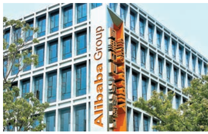
◆ 阿里巴巴負責人表示，集團出生、生長及發展均在杭州，全球總部始終在杭州，是自然也是必然。資料圖片

園區設計和建設圍繞「ESG、科技、人本」理念，融入海綿城市、雨水回收、碳中和、機器人無人車應用、生物多樣性保護等環保生態技術，打造綠色科技、智慧健康、潔淨能源的園區。