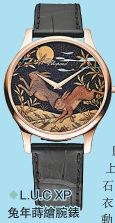
L.U.C. XP 兔年時繪腕錶