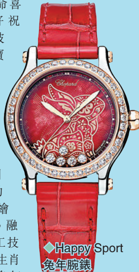
Happy Sport 兔年腕錶

蕭邦製錶經典之作——Happy Sport 腕錶披上全新節日盛裝，喜迎兔年，傳達「生命喜悅」的美好祝願。新款腕錶披上雍容華貴的寶石紅色「外衣」，體現運動時尚流行趨勢，33毫米直徑錶殼以精鋼和符合倫理道德標準的18K玫瑰金打造而成，五顆活動鑽石在裝飾兔年生肖圖案的精美珍珠母貝錶盤上靈動旋舞。而L.U.C. XP兔年時繪腕錶將金藝與漆藝巧妙結合，融匯精妙機械工藝與精湛手工技藝，推出88枚靈感源自中國生肖的限量版腕錶，喜迎農曆兔年的到來。這款腕錶採用符合倫理道德標準的18K玫瑰金錶殼，直徑39.5毫米，錶盤上呈現一輪皓月下機敏靈動的玉兔，展現中國神話中以「玉兔」指代月亮的傳統。