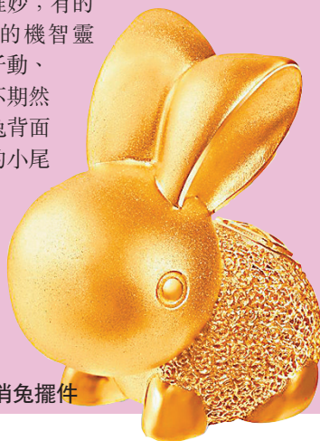
◆朝氣勃勃足金俏兔擺件

為迎接活力十足的新一年，英皇珠寶呈獻朝氣勃勃的足金金兔擺件，以999.9足金鑄造，備有三種不同重量以供選擇，分別約5錢、1兩及2兩重，可愛的金兔寶實背上刻有福字，寓意來年將幸福及財富載滿家中，常伴左右。喜氣洋洋五兔手鐲的設計靈巧生動，造型惟肖惟妙；有的眉開眼笑、有的機智靈敏，展示出兔子動、靜形態，讓人不期然會心微笑。金兔背面更有一條翹起的小尾巴，更顯手工細緻。五兔同賀新春，代表着五福臨門，富貴雙全，意頭十足！