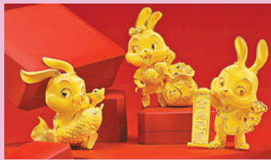
◆「富貴有餘」、「福祿滿載」及「金兔迎福」足金擺件

今個新春，周大福以福兔為主角，打造一系列足金賀年飾品迎兔年，包括擺件、吊墜、金條、嬰兒鎖包及手鐲等，款式別致，齊慶賀農曆新年的喜悅。百變造型的小兔配上多款喜慶吉祥物，如鯉魚、葫蘆和金元寶，寓意金銀滿屋好運連連。每款擺件及首飾均滿載祝福心意，可因應不同的對象自行配搭送禮組合，飾品形態像真凸出，多層次組合別具意義。佳節送禮，不妨考慮心思滿分的周大福「金兔迎福」生肖系列，向摯愛送上衷心的祝福，為節日聚首一堂的喜悅時刻增添多一份窩心暖意，成為閃耀新春的臻禮。