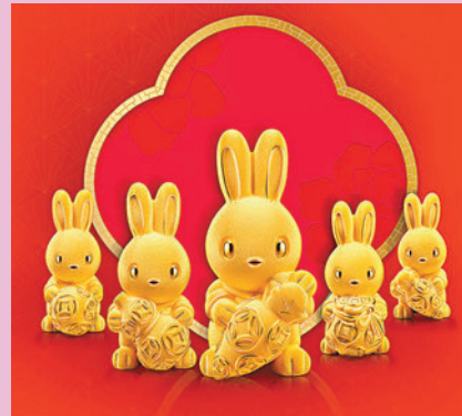
◆生生有禮「珍藏篇」999.9黃金擺件