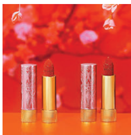
◆Rouge à Lèvres唇膏

同時，限量版Cushion De Beauté氣墊粉底亦為肌膚添上健康光澤，這款與肌膚融合為一的氣墊粉底，具備抗污染物、抗氧化、抗藍光及SPF防曬等親膚成分，達至輕盈保濕功效。