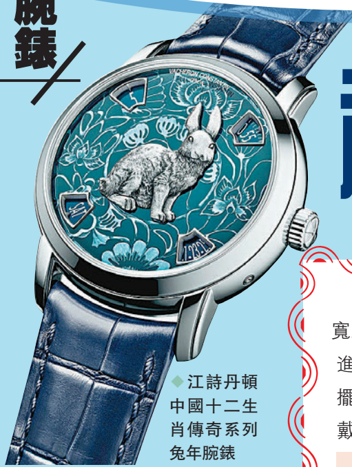
江詩丹頓 中國十二生肖傳奇系列 兔年腕錶