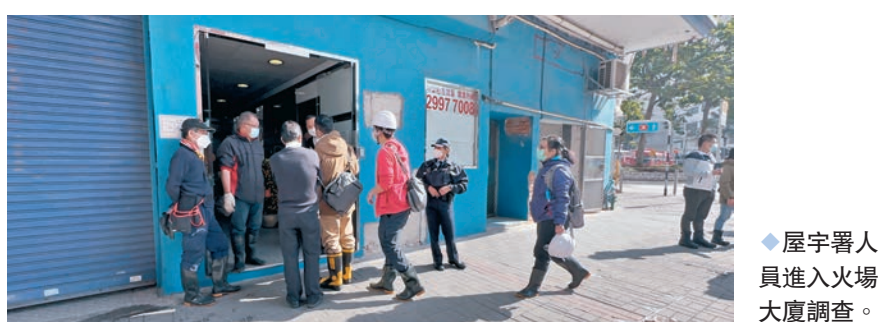
屋宇署人員進入火場大廈調查。