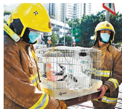
獲救的一對兔子由消防員抬走。