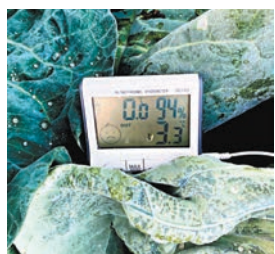
有市民在大埔元嶺村拍下農地菜田葉面結霜情景。

香港文匯報訊（記者 蕭景源）香港天氣持續寒冷，天文台前日及昨日連續兩天發出「霜凍警告」。天文台表示今日（30日）早上仍然寒冷，提醒農友及有關人士，清晨在山地或新界北部可能出現