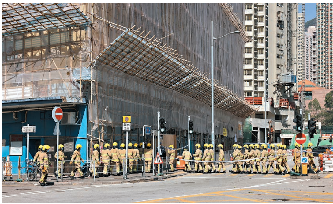
逾百名消防學院的見習消防員昨獲安排到現場分批上樓了解火場情況，並由教官即時講解。

新蒲崗永顯工廠大廈前日發生三級大火，消防、警方及屋宇署人員昨日續到現場調查，以查明起火原因、評估大火對樓宇結構造成的影響，以及火警期間大廈內手動火警警報系統未能正常運作的原因。有租戶投訴大廈消防設備不足，以及多割房存隱憂。有消防專家指，手動火警警報系統須按規定每隔12個月由註冊承辦商檢查一次，以確保運作正常。大廈法團則稱去年11月才完成消防系統的年檢。