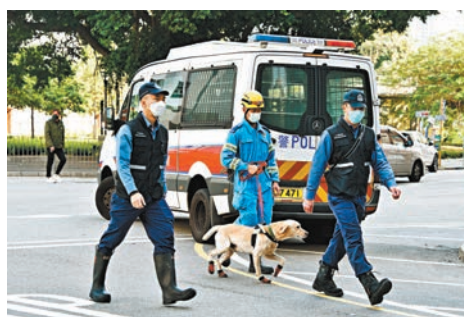
消防處火場調查組人員聯同火場搜索犬到場協助搜證。