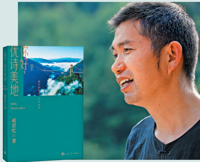
◆ 《你好，優詩美地》 ◆ 成君憶

成君憶，詩人，作家。1992年從業管理諮詢，而後開創了用文學路徑研究管理和歷史的學術流派。2003年出版《水煮三國》，至今已持續暢銷20年。自2018年開始連年旅居優詩美地，並因此成為一名鄉村振興戰略的志願者。係中國作家協會會員。