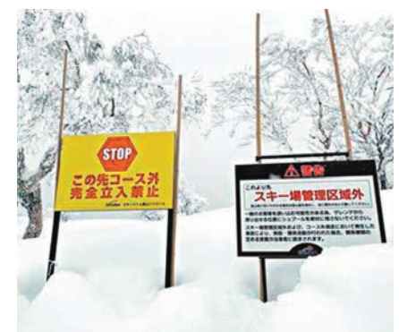
◆現場有告示警告遊客不得到滑雪場以外區域活動。