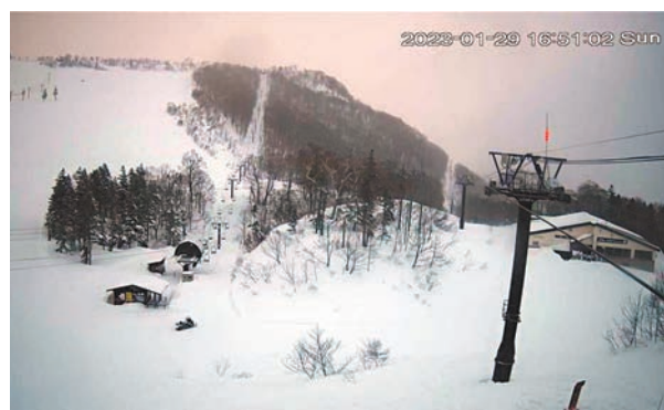
◆長野小谷村滑雪場當日的現場視頻。