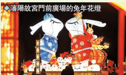
瀋陽故宮門前廣場的兔年花燈