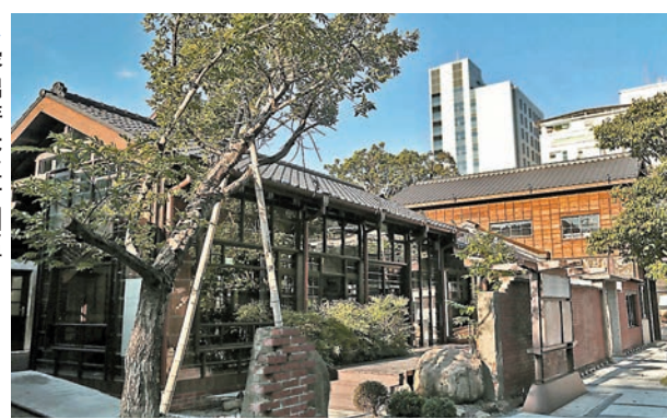
榕錦時光生活園區

六大燈區，主燈坐落於國父紀念館，中央展區包含孫中山紀念館及北市府廣場（南、北兩區），其主燈造型回到值年生肖玉兔主題，呼應「光源台北」主題，三座副燈分別以「蟠龍獻瑞」致敬千禧年台灣燈會九龍燈意象、「從心出發」以感恩之心感謝疫情期間辛勞的醫護人員，以及「躍動未來」打造有別以往傳統花燈形式之科技副燈，展現台灣燈會從經典到創新的精神。不僅如此，紀念館還將整座建築打造為「最經典的燈」，將精彩、璀璨的作品融入創新燈