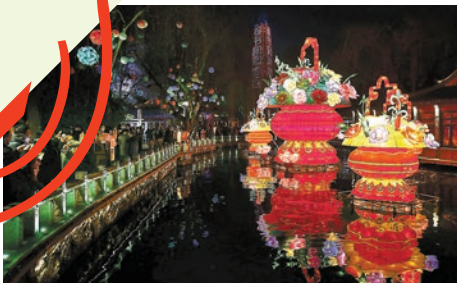
遊客在濟南的趵突泉迎春燈會上賞燈。