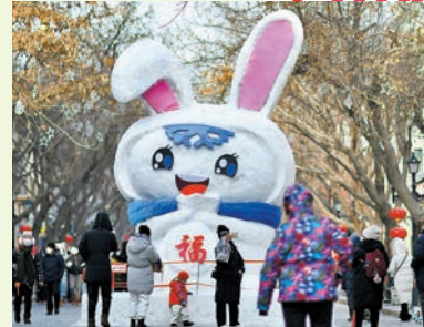
在哈爾濱中央大街，遊客和兔子雪雕合影。