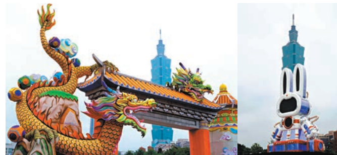
今年的主燈「玉兔壯彩」是一座科技兔主燈，將五彩斑斕的燈光作品與各式兔燈穿梭在這繁華似錦的城市中。