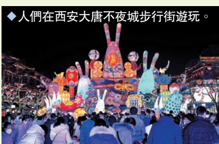
人們在西安大唐不夜城步行街遊玩。