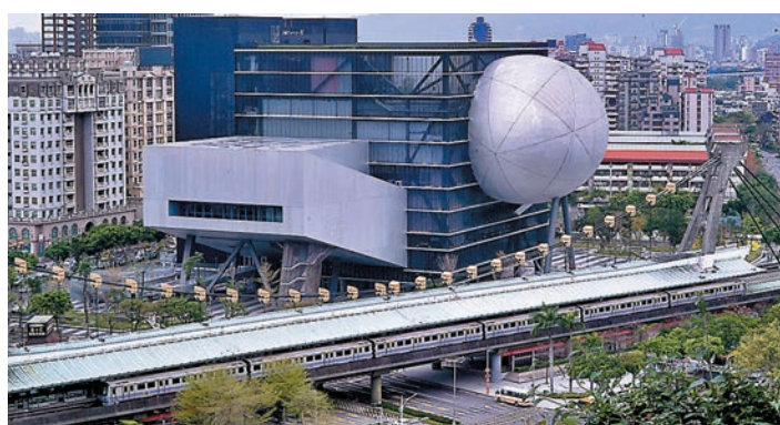
台北表演藝術中心