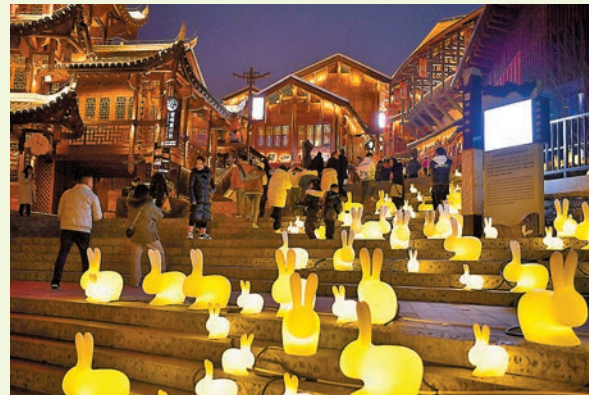
人們在黃水河畔觀看兔燈。

而瀋陽故宮門前廣場的兔年花燈維妙維肖。日前，在江蘇省淮安市盱眙縣第一山歷史文化街區崖壁廣場大型兔燈旁，遊人在觀看打鐵花表演。除了兔子花燈，在哈爾濱中央大街，還有兔子雪雕，遊客尤喜跟牠合影。而在廣州越秀西湖花市，更有兔子形象景觀花壇，吸引不少遊客拍攝。另外，西安各大景區人潮湧動，市民及遊客到來體驗古都人文氣息，感受新春佳節的氣氛。