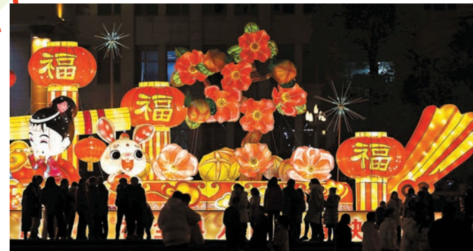
人們在貴州省銅仁市玉屏侗族自治縣舞陽廣場觀看燈展。