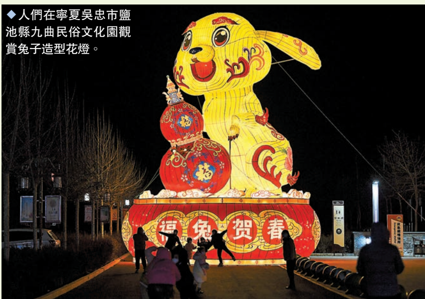
人們在寧夏吳忠市鹽池縣九曲民俗文化園觀賞兔子造型花燈。