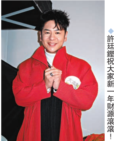
許廷鏗祝大家新年財源滾滾!