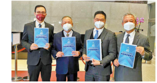
◆自由黨與財政司司長會面，就2023/2024年度財政預算案提出建議。

他並建議，為照顧不同香港市民的退休需要，特別是中產階層，特區政府應與內地加強協調，讓購買香港年金等退休保障計劃並居住在大灣區各城市的市民都可以取得相關