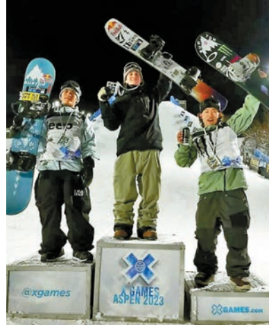
◆蘇翊鳴（右）在坡面障礙賽獲第3名。

2022年北京冬奧會上，蘇翊鳴在單板大跳台和坡面障礙兩個項目中收穫1金1銀。相比世界盃和奧運會，世界極限運動會的比賽輪次較多，對於首次參賽的選手來說需要花更多時間適應。