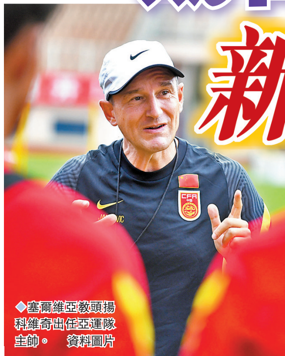
◆塞爾維亞教頭揚科維奇出任亞運隊主帥。資料圖片