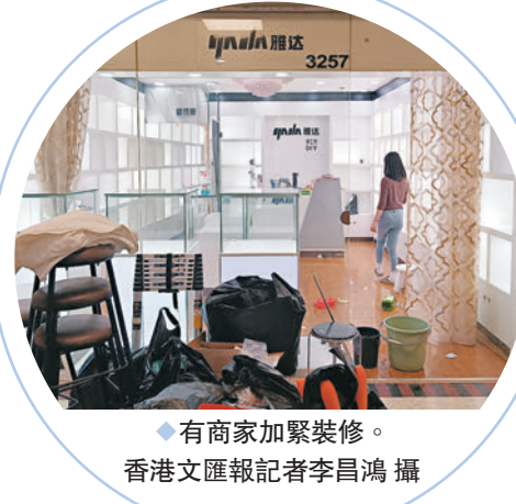
◆有商家加緊裝修。 香港文匯報記者李昌鴻攝