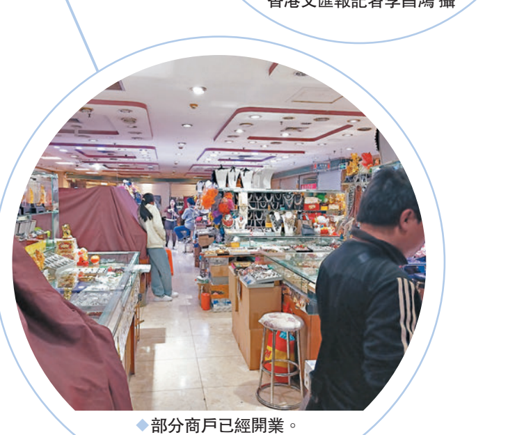
◆部分商戶已經開業。