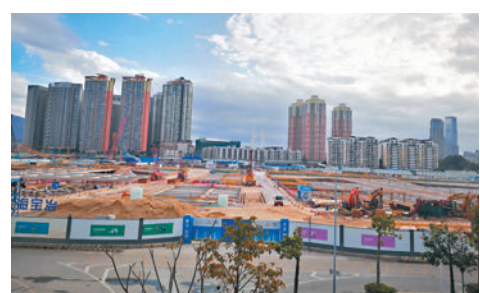
◆新皇崗口岸工地。

31日下午,香港文匯報記者趕到皇崗口岸時發現,工地外側停滿了施工車輛,從外圍看,