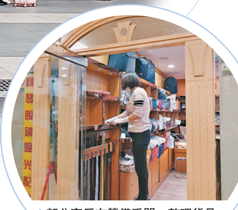
◆部分商戶在籌備重開,整理貨品。