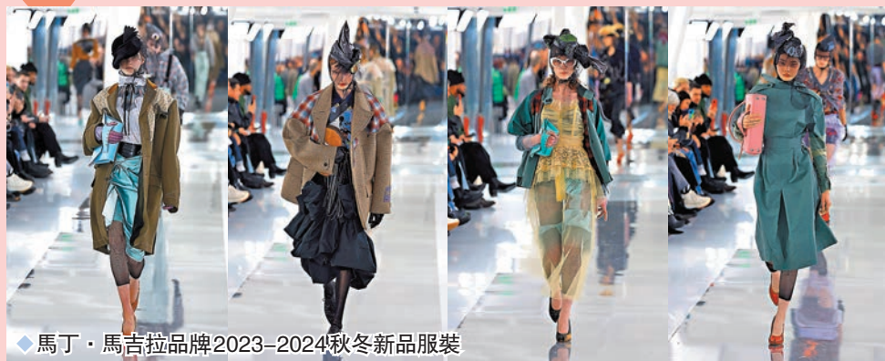
◆ 馬丁·馬吉拉品牌 2023-2024 秋冬新品服裝

2023-2024 巴黎秋冬男裝周於早前在法國正式舉行，在時裝周上，模特兒展示了馬丁·馬吉拉及山本耀司的秋冬男裝，剪裁新穎，各有特色。