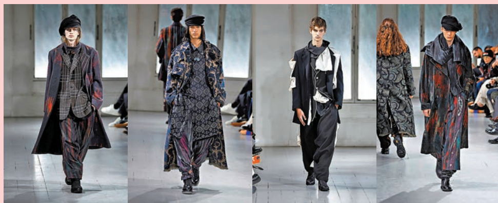
◆ 山本耀司 2023-2024 秋冬新品男裝

2023-2024 巴黎秋冬男裝周於早前在法國正式舉行，在時裝周上，模特兒展示了馬丁·馬吉拉及山本耀司的秋冬男裝，剪裁新穎，各有特色。