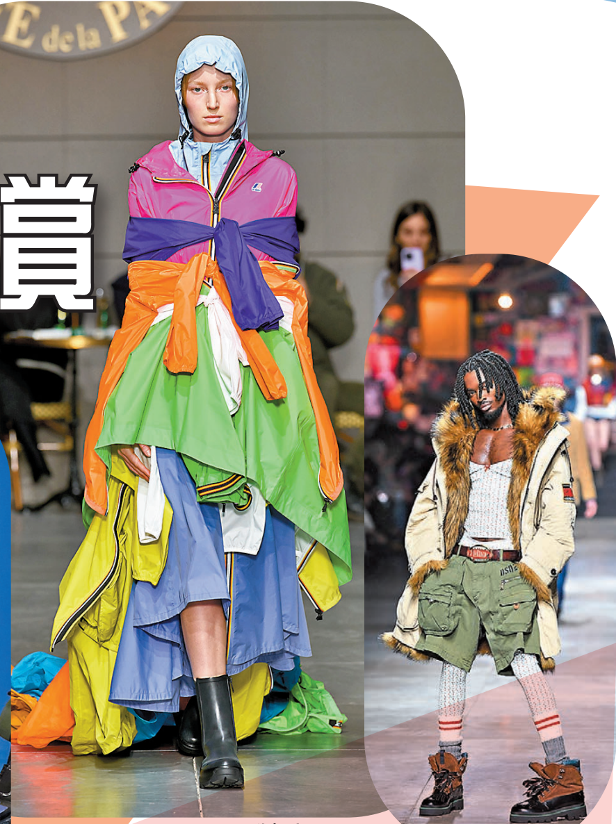
◆ K-Way 2023 秋冬秀