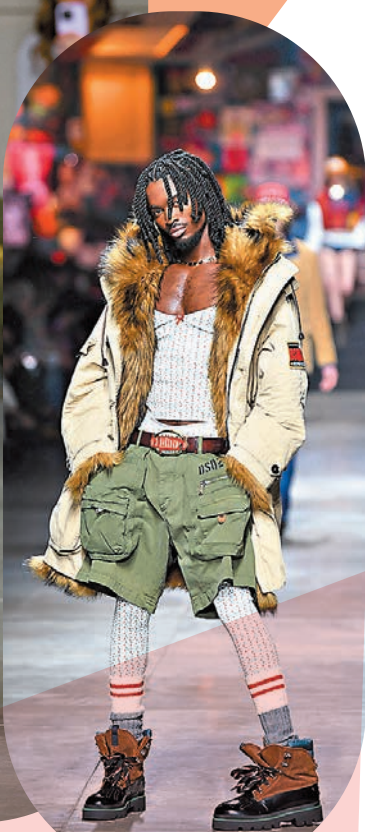
◆ Dsquared2 品牌時裝