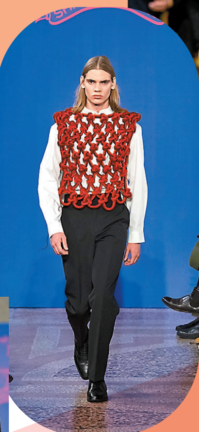
◆ 上海灘 2023 秋冬男裝系列《團圓》