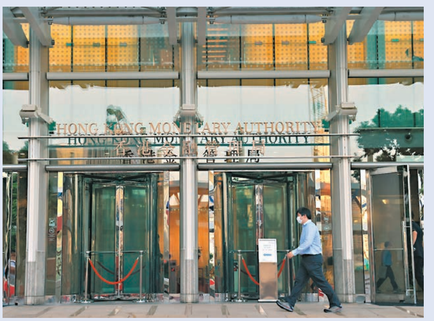
◆金管局指適當的監管環境，有助應對穩定幣可能帶來的金融穩定風險，並促進業界有序和持續發展。 資料圖片

去年5月份美國大幅加息，全球虛擬貨幣大暴瀉，穩定幣之一的LUNA一天內暴瀉99.9%，蒸發500億美元市值後破產，投資者所有資產盡化為烏有。 資料圖片