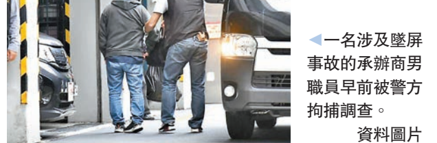
▲一名涉及墜屏事故的承辦商職員早前被警方拘捕調查。

香港文匯報訊(記者 葛婷)警方於早前就男子組合MIRROR在2022年7月紅館演唱會墜屏傷人事故，落案起訴總承辦商「藝能工程有限公司」2男1女一項串謀欺詐罪，以及屬於交替控罪的欺詐罪。3人昨日在九龍城裁判法院首度提堂，暫無須答辯。署理主任裁判官黃雅茵應控方要求，將案件後至3月30日再訊，以準備將案轉介區域法院審理的文件。3人各准以一萬元保釋，須每周到警署報到，在報稱地址居住，不得離港，交出旅遊證件，以及不得直接或間接與控方證人討論案情。