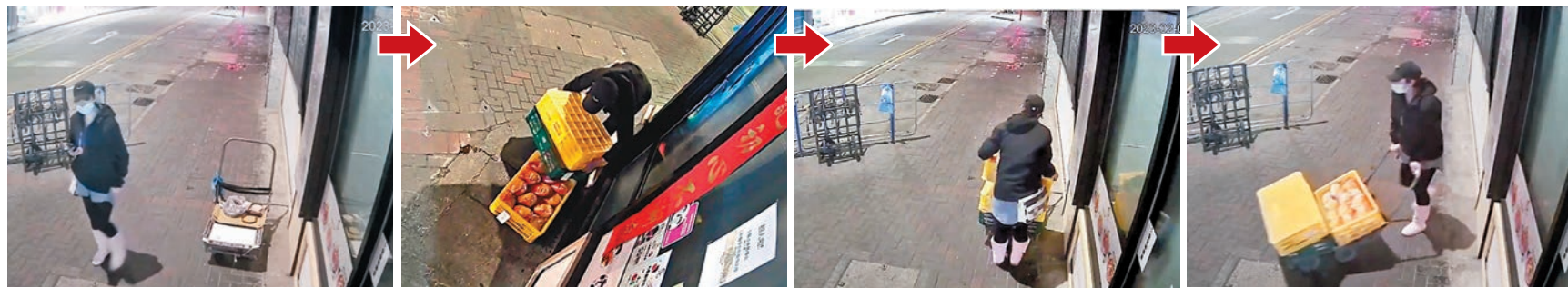
◆女偷雞賊犯案時身穿黑色衫褲，頭戴黑色鴨舌帽，帶備一部手推車，在店舖外首先搬起兩箱雞。網上片段截圖。