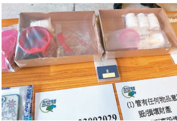
◆警方檢獲用作非法收數用的紅油。

批非法收數工具，包括紅油及「欠債還錢」的追數單張等，另檢獲一張屬於他人的住戶證，遂將兩人拘捕及交由反黑組跟進。