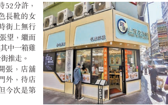
◆遭女賊偷雞的食肆因無雞作食材，被迫暫停推售招牌「花雕醉雞」餐兩天。

警方於上午11時許接獲店舖報警，列作「盜竊」案處理，交由油尖警區刑事調查隊跟進，正追緝一名身高約1.6米高涉案女子。