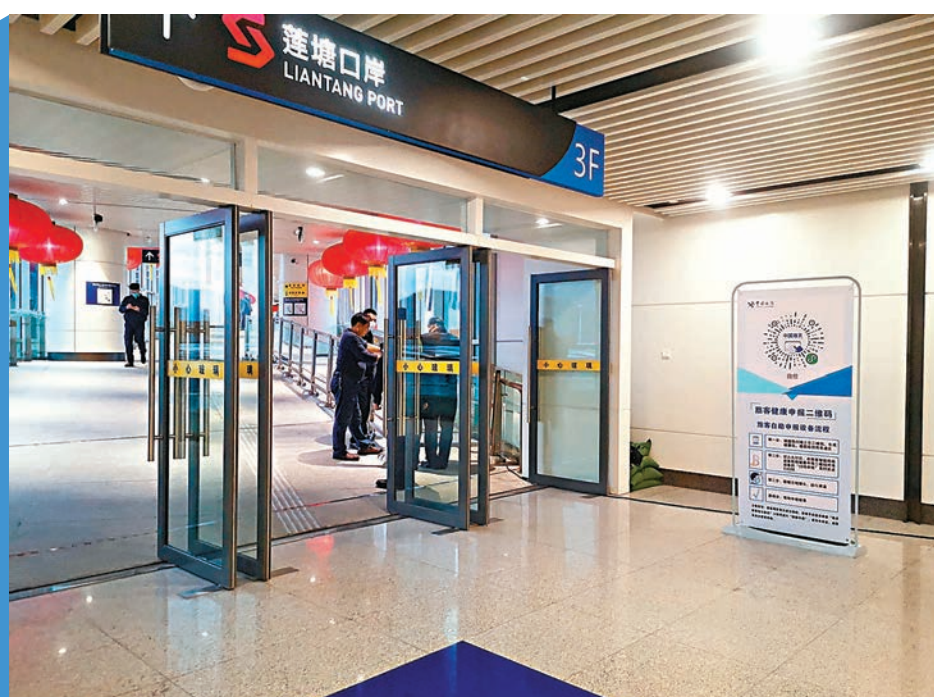
◆蓮塘是第一採用「人車直達」設計的口岸。