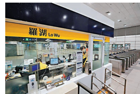
◆重開羅湖口岸或造成港鐵人手緊張。

林志強表示，雖然目前運行的九卡列車較以往十二卡列車運力減少，但新信號系統更先進，可加密班次，相信能彌補運力，應付早晚通關高峰期。惟重開羅湖口岸造成港鐵人手緊張，「人手勉強，但如果同事放假，其他同事只能加班頂更以維持列車運作。」工會已要求港鐵盡快增加人手。