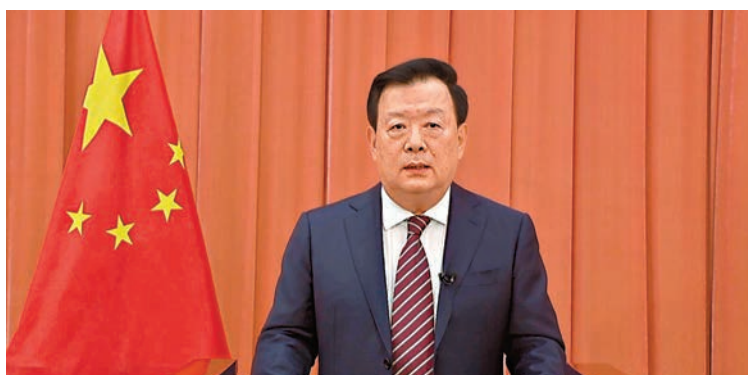
◆夏寶龍 資料圖片 會上，中央港澳工作領導小組辦公室、國務院港澳事務辦公室，香港中聯辦，澳門中聯辦，駐港國安公署，外交部駐港公署，外交部駐澳公署作了交流發言。中央港澳工作領導小組成員單位與會人員在北京主會場參加；中央駐港、駐澳機構與會人員分別在深圳、珠海兩個分會場參加。

夏寶龍指出，黨的二十大報告關於港澳工作的重要論述，是對「一國兩制」實踐經驗的高度凝練和科學概括，是習近平新時代中國特色社會主義思想的新成果，為做好新時代港澳工作提供了根本遵循。深入學習貫徹黨的二十大精神，港澳系統必須深刻把握習近平總書記關於港澳工作重要論述的精髓要義，更好用以指導港澳工作實踐。要清醒認識「一國兩制」前進道路上面臨的各種考驗，克難攻堅、守正創新，團結奮鬥、實幹擔當，更加扎實有效地做好各項工作。