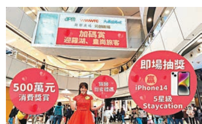
為迎接全面通關，港商場加碼推展情人節消費獎賞。

隨着羅湖、皇崗口岸即將於2月6日起全面通關，預料佔盡地利優勢的apm商場及上水新都廣場將直接受惠，而跨境巴士往返apm及皇崗口岸將重投服務。