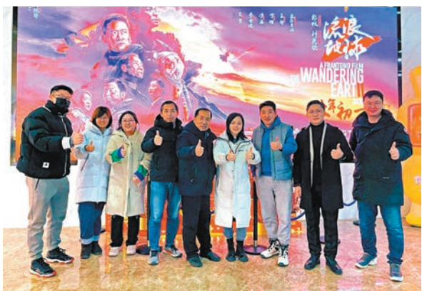
◆科學顧問為觀眾釋疑。