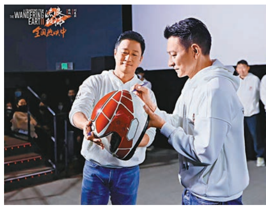
◆在前天的北京的路演上，有影迷請吳京與劉德華在其頭上簽名。