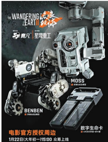
◆《流浪地球2》周邊衍生品十分受歡迎。

從《流浪地球2》三款周邊衍生品成交量上來看，機械狗「笨笨」人氣最高，不少影迷直呼早日實現「一戶一笨」。此外，劇中的數字生命卡、MOSS也非常受歡迎。不少粉絲直言：「我們買的不是周邊，而是中國科幻的未來！」