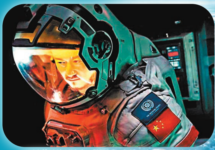
◆吳京飾演的劉培強不僅經歷了妻離子散，在面對全人類生死存亡之際，也勇敢接下死亡的任務。