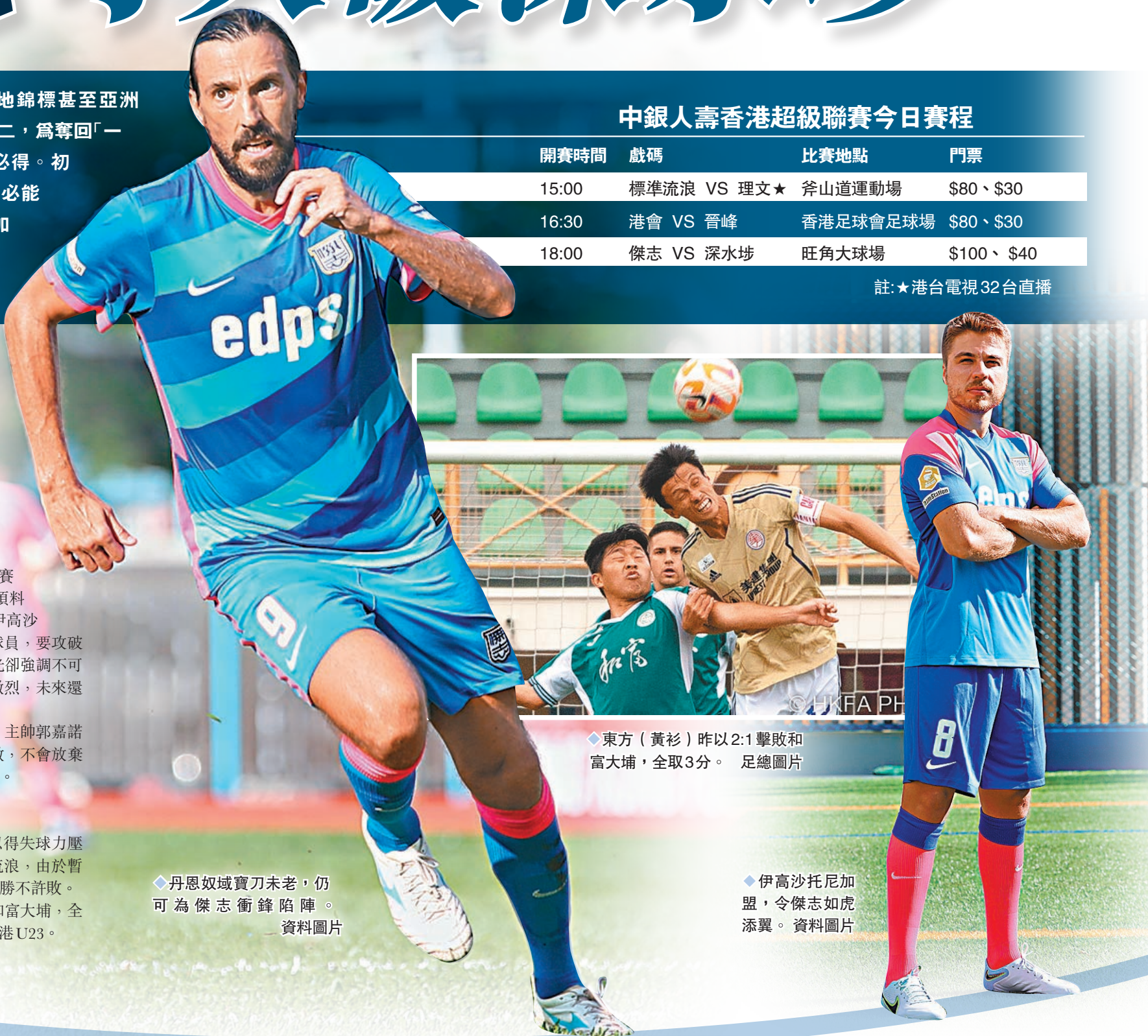
◆東方（黃衫）昨以2:1擊敗和富大埔，全取3分。

港超今上演3場賽事（見附表），除傑志對深水埗外，暫以得失球力壓傑志位居聯賽積分榜榜首的理文將在斧山道運動場迎戰標準流浪，由於暫居榜眼的傑志虎視眈眈，理文面臨不少壓力，今日一仗可謂許勝不許敗。至於昨日進行的兩場港超賽事，東方作客大埔以2:1擊敗和富大埔，全取3分。冠忠南區則到訪將軍澳運動場，以3:1輕取香港U23。